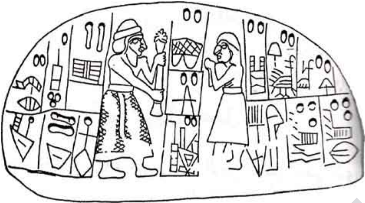
تیمووزی و نهانانا

نازانم، که گفتوگۆ لهسەر مهیسهسته سیاسییهکهی لیکۆلهر بکه، هیندی دهمووی ژیر زهوی له لایانهی کتیهکه بکه، که نهوورژ به کورد دهبهستیهوه له (عیراق!!!) داو ریشتهی نهوورژیش دهگهرینهوه سهردهمی سۆمه و بهتایبهت بهسهرهاتی (عشتار و تهموز)، که لیره پشت به بهلگه میژووویی و لیکۆلینهوه ئەکادیمییهکان دهیست: