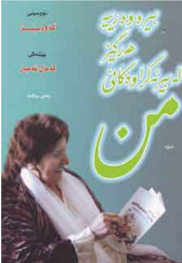
بۇ خویندەنەۋەى بىرەۋەرىيەكانى نووسەر، كە دەتۋاىن بلىنن باسكردى سى سەردەمى جىۋان، لە واقىعى كوردستان و عىراقدا، لە روۋى مېژۋويىيەۋە بايەخى خۇى ھاۋىشۋوۋە بۇ چەند لايەنىك، كە ھىۋادارىن لە ماۋەيەكى نىكدا گەلاۋىژ خان بەشىى دوۋەمى بىرەۋەرىيەكانى بە وىنەۋە بەچاپ بەگەنەى، لەگەل دەستخۇشىماندا.

ئەم بىرەۋەرىيە، تىكەلكردى ژياننامەى تايپەتسى خىزانى و باروۋىخى سى سەردەمى جىۋان، لە واقىعى كوردستان و عىراقدا، لە روۋى مېژۋويىيەۋە بايەخى خۇى ھاۋىشۋوۋە بۇ چەند لايەنىك، كە ھىۋادارىن لە ماۋەيەكى نىكدا گەلاۋىژ خان بەشىى دوۋەمى بىرەۋەرىيەكانى بە وىنەۋە بەچاپ بەگەنەى، لەگەل دەستخۇشىماندا.