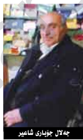
جەلال جۆباری شاعیر

لە ناو شار بە زێرەکی ناوی دەرکردبوو. بەبانیان قوتابی کاتی ریز دەکران ئەو یەکیک بوو لەم قوتابییه بەتوانایانە شیعری نیشتمانی بۆ قوتابیان دەخویندەوه، یەکیک لەم شیعرانە: کۆردە تاکەیی بی خەبەری نووستن بێ عارییه واستەتی دواکەوتنت هەر بیکارییه