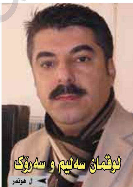
لوتمان سه لیم و سه ره رۆک