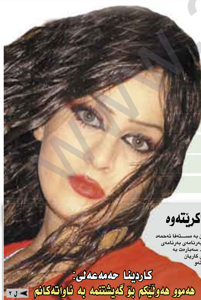
کار دینا حه مه عه لی: هه موو هه ولێتکم بۆ گه یشتنه به ئا واته کاتم