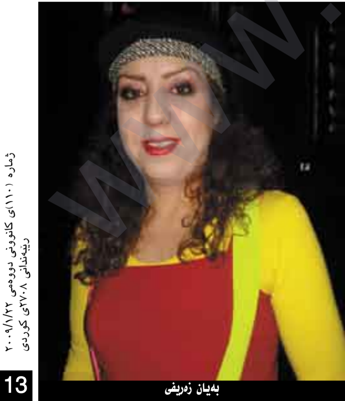
شماره ۱۱۰۱ كانوني دوومي ۲۰۰۹/۸/۲۲ زينداني ۲۷۰۸ كوردي