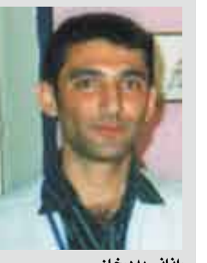
رانانی به درخان

کتیبی (پیسوونی بینین و کاریگری له سره رهفتاری گومه لایه تی) که له نووسینی هه وران محمدا، له بلاوکرده کانی مه کته یی پیرو هوشیاری (ا.ن.ک.ا.ه)، که لیکوینه وه یه کدی گومه ناسیه، که بریتیه له (۲۳۱) لاپره، سانی ۲۰۰۸ له دزگای چاپ و په خشی هه مدی له سلیمانی چاپ کراوه. به هه سستی زیاتر تیشک خسته سهر لایه ناکانی نهو کتیبیه، به درخان به چاکلی زانی نووسه ری لیکوینه وه که بلوینت و بدم جوړه یاس له نه زموونه ی خوی بکات: له گهر و ادبیریت که ژینگه سه رهجه می نهو جوارجیوه سروشتی و ژبیری و گومه لایه تیبه یه، که دهوری مروقی