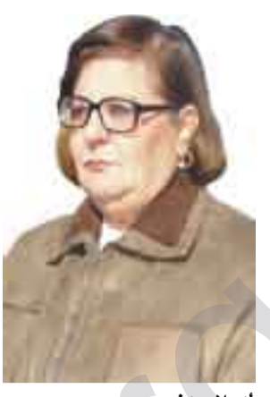
نه حلام مهنسور

حکایه تسی شووکردنی به تویزی هزار باره دکاته وه. شهش حهوت حکومت له عیراقا گوراو و جهنگی عیراق و نیران بهر یابوو کورنیک له دستدا، سهدام له سیداره درا، حکایه ته کسه شووکردنه کدی دایکم له لای خویوه جوړیکه له جوړه کانسئ نه افغال و هه له بیجه و نهو کاره ساتی که له عیراق و نه افغانستان و فه له ستین و دارفور روو دهن، یان نهو کاره ساتی که له کوسو قو و شیری براکوژی لوپانی یان شهردکانی نه فیه ریقاو رووخاندنی سیسته می سوشیالیستی سؤقیهت بهس نه بوون بؤ کو تایی هیئانی یان سرریه وهی یادهم ریبه شوومه کانی تیپه ریوونی نهو جوړه زه لیلیه ی باوکیشم بووه دهرنیک بؤ من، که هه میشه بؤ کس کاره ساتی که له کوسو قو و شیری دهنگ نه کهره کدی خانه قین، که هه میشه نازناوی نهو پیاوونه بوو، که له مالدا هه میشه زه لیل بوون و پیاوونه دهن نازناوی دهنگ نه کهر. راسته نه قلی باوکم ته قه لیکي زپین بوو و گری نه لکترا وای لینه کرم، که نه قسه یه بکه م، به لکو به شپوهیه که دتوت هه موو باخه کانی له نیو میسکیدا ناویدر دهرکین و رگ و ریشی درخته کانیان خوینی دهمژن و دینه چهن جؤک یه که له فرمیگ به نه سپایی و هینمیبه وه ده کو لین و داده جوړیکه وه ناهه بیر ناساکه ی باوکم و دله سه بوره کدی و دووباره هه لده قو لین و ده کو ساغی په پن دهرایتنه سهر نهو یه کم هه نگاوهی که به هه لوه نای بؤ نهوهی جووت بیته وه و هه جووت نه بوووه له گهل نهو کیوه دوازه سهاله ی قوتایی سهر دتایی قوتابخانه ی کجانی خانه قین. نه مگرینتیته سهر (قه دم خیر)، ناشیزان به چهن دیشک هه نگاوه کانی ده گنه دهنگ دانه و دکانه نهو، من ته نیا یه کیشتم بیئوه، نهویش پشنتی باوکمه، که به سه ده های