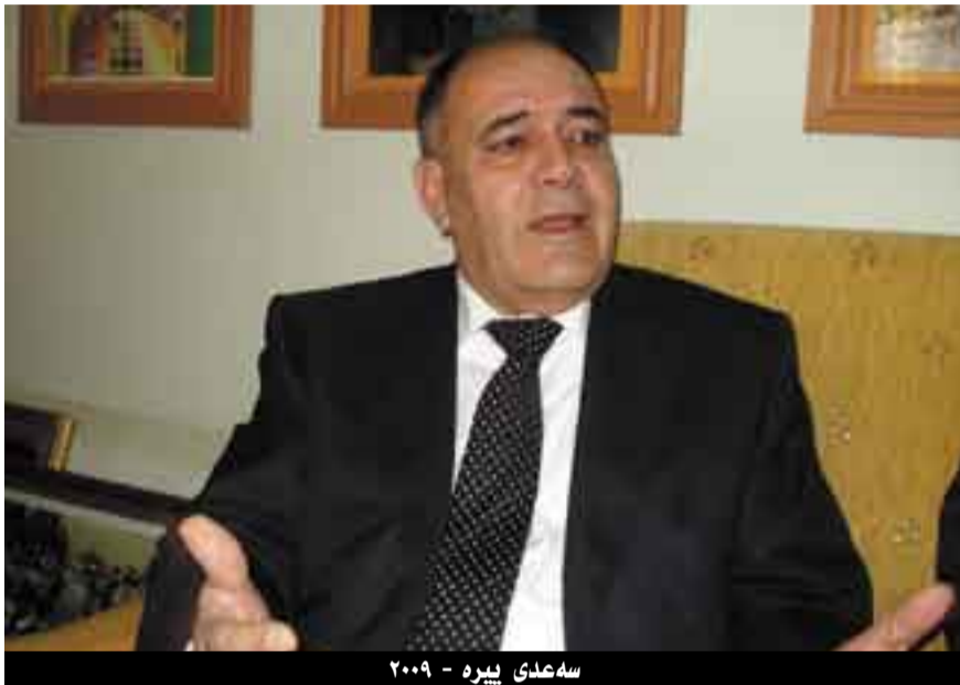
سهعدی پیره - ۲۰۰۹

- کوردستانی نهگهر مههبستت ههموو کوردستانی گهردیه، نهوه جارې وهزیفهی نیمه نییه، بارووخی عیراقی نیستا هیشتا له دلهمههیه، لهوحه سیاسی له جولهمایه و له عیراق تهنگهژهیک ههیه پیی دهلین قهرانی ناسنامه، عیراق له بهرتههوه که وهکو دولته دامزراوه، به شیوهیهکی ناتهدروست دامزراوه، هیزیک دهرمکی دوو ولاتی دروستکرووه له ناوچهیه بیق رازیکرنی بنهمالهی هاشمییهکان، ههموو خهلکانی تر به کورد و عهرهپ و شیعه و سونه و مهسیحی و تورکمان دلسوژی و خووشویستیان زور کم بووه بقی نهو عیراقه، که کیشهی لی دروستکراوه و حکومتهکانی عیراقی پهک به نوبی عیقش وا نههاتوون که خویان له نویتهی ههموو خهلی عیراق و بهشجویهیهکی گشتی پهکسانی خاریکی پهک بکهن لهگهل ههموو سیالی ۲۰۰۳ش که مروقی پله ۲-۳ بووه، گنجی کورد تهنگهژنی ههبووه بلی من عیراقیم، که چهوساوتوه لایهبر نهوه نییه که عیراقیهی، بهلکو لایهبر نهوه نییه کوردستانی، رهنکه شیعهیهک زور ناسای بووه عیراقی دولته بیانداته بهر هیزش و شلالوی گولله، بهردو نیرانیان ببا تا له عیراق جیایان بکاتهوه لهزیز چهرتی خویان، یان ههتا نهوانهی راویسترانن به تایبتهی شیعه، ولاته عهرمیهیه سوننهکان نامده نووسینگهیهکان کردوتنهوه له بهغدا و له ناینداره رهنکه نهو نووسینگهیه بییته نووسینگهیه ههموو ههریم، نووسینگهیه پهیونددیه گشتیهکان نیشتی نهویه لهگهل کهسایهتی سیاسی و زانستی و کومهالیتهی و مزمهیی و لهگهل هونرمهاند و نهو کهسانه یی چالاکن له بواری راگهیاندن و دامزراوه عهشایریههکان و بگره پاریزکاگانیش پهیوندی بهستین بقی تیگهیشتی نهولی داخواری کورد و نیسینگهستی کورد بقی بکهوژدیان و ناینددی عیراق، نهوه دهبن قسهی لهسهپر بگرئ، تنهتا له ریگای روظنامه یان کس و لایهتی