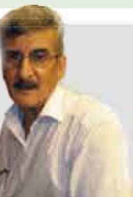
دالی به کوردی گۆرانی ده لیت

دوا ی ئه وه ی ده نگۆی وه ستانی یه که ره کی به رنامه ی به رنامه بلاوکراوه، به یوه ندیمان به سه سته فا ئه حمه د ده ره نه ری ئه وه به رنامه یه کرد و ئه وه یه سه بارته به وه گوئی: به رای من جاریکی دیکه به رنامه ی به رنامه ی نا کریته وه، یانی ئه که ر بکریته وه به شیوازیکی دیکه و جیاواز ده بی له به رنامه ی به رنامه. سه بارته به کاستی به رنامه ی داها توش گوئی: رازی نیم له گه ل هه ندیگ له وه براده رانه ی له و کاسته ی کاریان کر بووه، کاریان له گه ل بکه م. سه بارته به هۆکاری ئه وهش گوئی: هۆکاره کی ئه وه یه ئه وه به رنامه یه کۆمه لیک کیتبه و گر فتی هه بوو، هه مووی به سه ر یه که وه که له که بوون و ئه وه به رنامه یه ش ئه وه هیز و توانا و کاریگه رییه ی جارانی نه مابوو، وایله هاتبوو هه ندی که س ده یانگوت ئه وه به رنامه یه بیی و نه بی وه کو یه که، بۆیه ئه وه شتانه بوونه هۆی ئه وه ی به رنامه که را بگری.