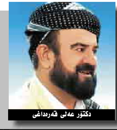
دکتۆر خەڵی قەرەداغی