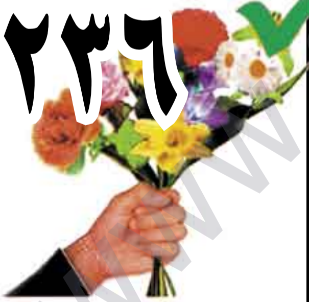
لیستی بریایەتی و پیکهوه ژیانی ناشتیانە