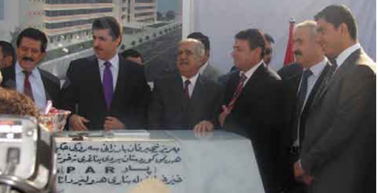
دانانى بەردى بناغەى نەخۆشخانەى پار لە ھەولێر - ۲۰۰۸/۱۲/۱

دەرپارەى لەدانانى بەردى بناغەى ئەو نەخۆشخانە، کەبیرۆکەى دروستکردنی لەلایەن کاک کۆسرت جیگری سەرۆکی ھەرێمى کوردستان بوو ھەوڵێرو ژمارەیکى زۆر لەلێرسراوانى حزبى و حکومى کەسایەتى و ھاوولاتیانى شارى ھەولێر بەردى بناغەى نەخۆشخانەى (پار) خیرخواری تاییەت بەکەس و کاری شەھیدان و ئەنفال و پێشمەرگە دیرینەکان دانرا.