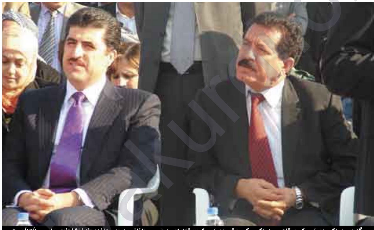
جیگری سەرۆکی ھەرێمى کوردستان و سەرۆکی حکومەتى ھەرێمى کوردستان لە مەراسیمى دانانى بەردى بناغەى نەخۆشخانەى پار - ۲۰۰۸/۱۲/۱

زۆر بە جدى پشنگیری لەو پرۆژەییە دەکات، دەستخۆشی لەبەنەمالەى شۆرشگێرو خەباتگێر کاک کۆسرت دەکات بۆ ئەو ھەنگاوی ئەمرۆ لەشارى ھەولێر ناویانە، ھیوادارین نەونەیان زۆر بیت لەھەری کوردستان و زۆر سوپاسی بەرێژیان دەکەین، ھەروا گوتی بەدەنیاویەو خانەوادەى شەھیدان و ئەنفال و پێشمەرگە دیرینەکان پێوستیان بەم کارە خزمەتگوزارییە ھەبە لەھەری کوردستان، لەبەر ئەوە بۆ ئەوەی ئەم خەونەى ئەوان بێتەدى لەھەولێر، گوتیشی لەم شۆینەى ئیسنا کە مالى کاک کۆسرت بوو، کاک کۆسرت داواى لەمەن کرد، کە ئەم زەویەى تەسلیم بەکەین، رەنگە زۆر خەلک وای بۆجووبی، کە بەنیازی دروستکردنی خانووە بۆخۆی لەسەر ئەم زەویە، بەلام زۆر بەخۆشچالییەو، کە قسەى لەگەڵ ئیمەکرد و داواى تەواکردنی مامەلەکانی ئەو زەویە ئەوکاتە گوتی من ئەم زەویەم بۆخۆم نییە و بۆدروستکردنی خانووم نییە، بەلکو دەمەوێ لەسەر ئەم زەویە نەخۆشخانەیکەى خیرخواری دروستبکەم بەناوی ئەو ئازیزانەى لەشۆرش لەدەست داو، دیارە ئەمە گەرەبى ئەو پیاوھ گەرەو شۆرشگێرە، ئیمە دەستخۆشی لێدەکەین، ھیوادارین نەونەى لەکوردستاندا زیاتر زیاتر بێن و سوپاسی ھەموو لایەکتان دەکەم و خۆشم زۆر بەبەختەوەر دەزانم، کە ئەمرۆ لەو مەراسیمە بەشداریم کردوو. باشان دکتۆر زریان عوسمان وەزیری تەندروستی و سەرپەرشتیاری پرۆژەکە و تەبەیکى پێشکەشکردو تێیدا وێزای بەخێراتى میوانان و ئامادەبووان