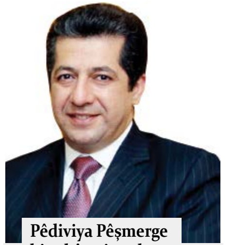
Pêdiviya Pêşmerge bi çekên giran heye

BHL'yê ku beriya niha li Bosna, Ûkrayna, Lîbya, Tûnis û Çeçenistanê jî çûbû eniyên şer û wênayan kêşabû, bi wênayan xwe yê bi Pêşmergeyan, di medyaya civakî de bi ser kolajên bû cîhê tînazan. BHL roja ku van wênayan parve kir her wiha di Govara Le Point a Fransî de gotarekê bi sernavê; "Wê DAIŞ çima têk biçê" jî weşand. BHL di gotarê de amaje bi Hovîtiya cihadperestan kirî ye û gotiye: "Ew terorîstên serkeftî ne lê leşkerên bêkêr in"