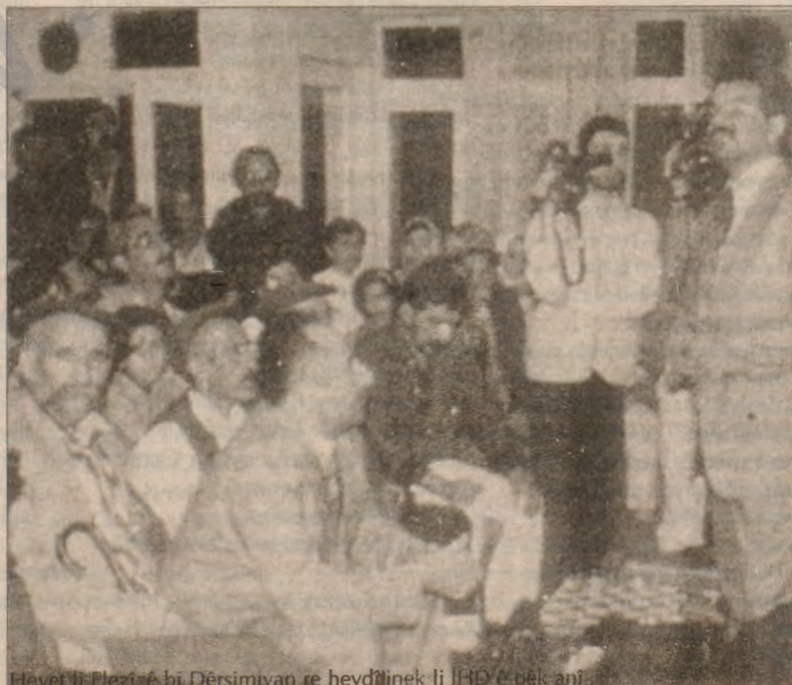
Heyet li Elezîzê bi Dêrsimiyên re hevdîtîna li İHD'ê pêk anî.

"Dema em ji Dêrsimê çûn Amedê, bi min werê hat ku ez ji girtîgehê derketim û çûme cihekî azad."