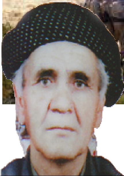
Hevpeyvîn: Faxir mewlod

H emexan Efendî kurê Mewlûd, sala 1322'an (1943) li gundê "Axdere" ya ser bi bajarê Diwanderê di malbatek desteng û hejar de tê dinê.