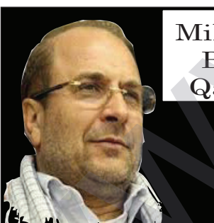
Mihemed Baqir Qalîbaf

Erdoxan bila dest ji kar berde û guh li daxwazên xelkê nerazî bigre