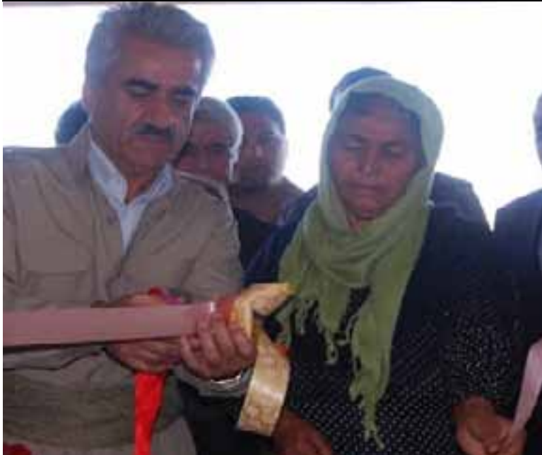
Birêz Mistefa Hicrî û hevîna şehîd Xale Şêx Mihemed Bilbasî di dema vekirina hola wênayên şehîdan de