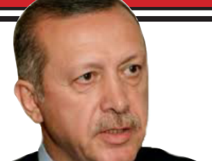
Receb Teyib Erdoxan

Ez dijî wê me ku jin bibe wezîr, jiber ku jin xwediye ezmûnên heewce nine, û wezîrbûna jinê ne di berjewendiya welat de ye