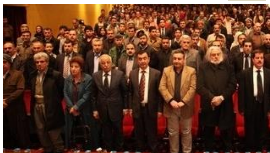
Beşdarên rê û resma 2'ê Rêbendan, Hewlêr başûrê Kurdistan, 2013