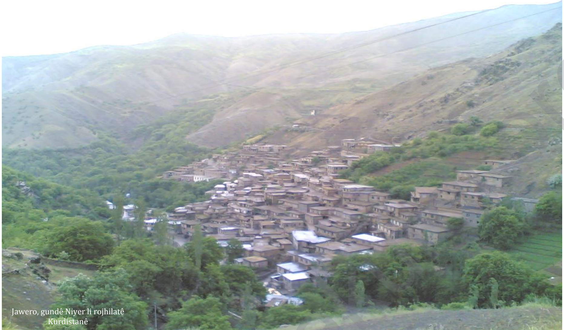
Jawero, gundê Niyer li rojhilatê Kurdistanê