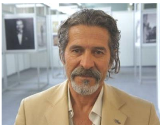
Desteya weşana duheftînameya Agirî

Rehma xwedê jê be û cihê wî jî buheştê berîn be