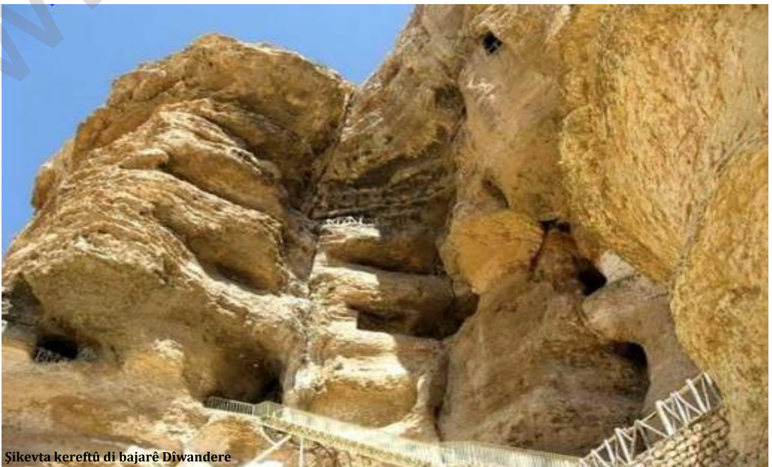
Şikvta kereftû di bajarê Dîwandere

Dîwandere her wek derbasbûyî li çepera berevanî ji xwestekên gelê Kurd de rawestayê û hertim wek Kela Kurdayetiyê tê mêzekirin.