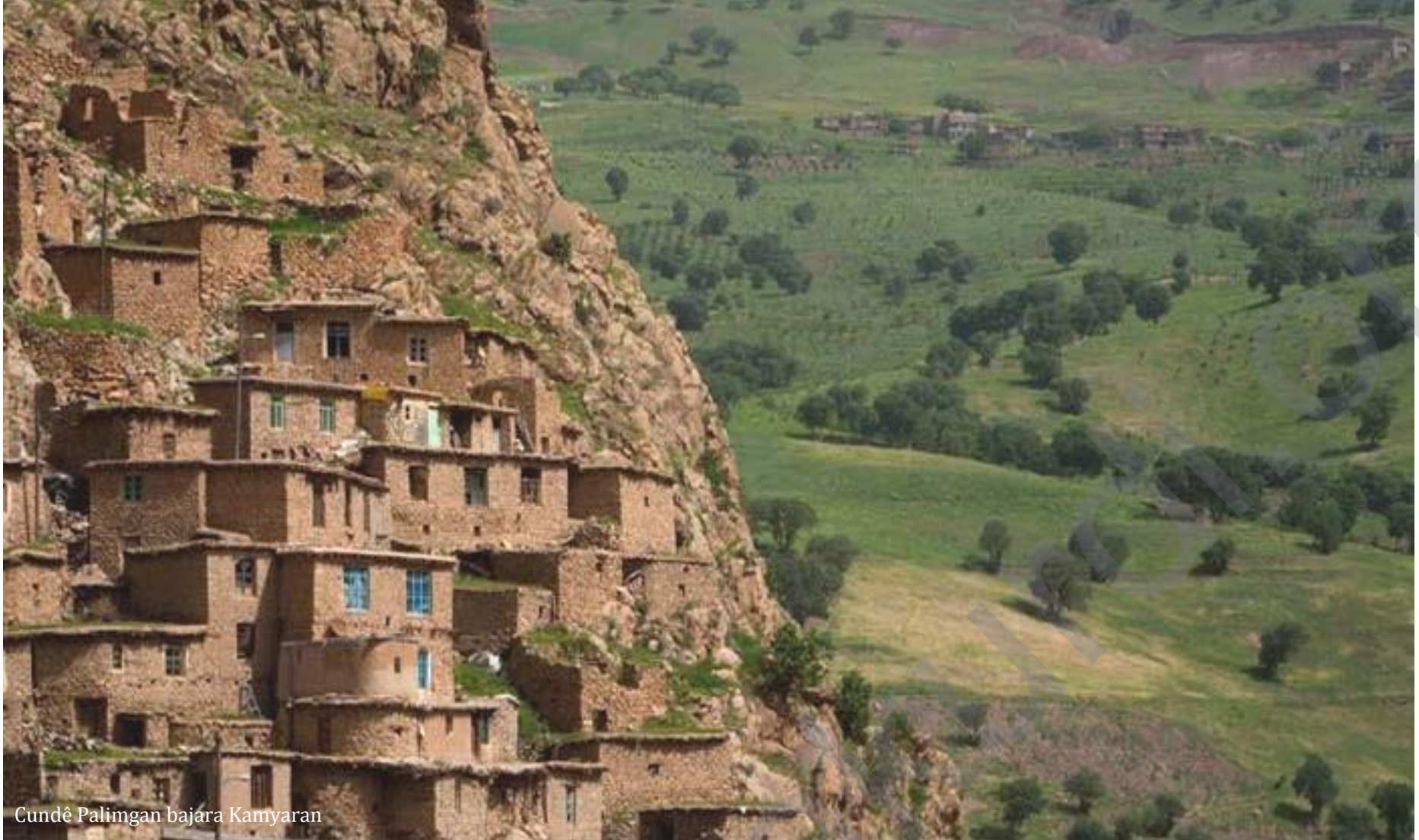
Cundê Palimgan bajara Kamyaran