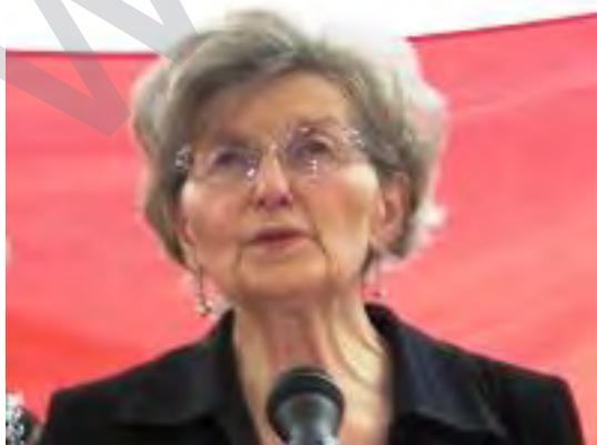
Xortên Neteweya Kurd! Hevalên PDKÎ! Hevalên rêzdar! Kongireya we ya pazdê hat û ew yek jî

selmînerê vê rastiyê ye ku PDKÎ li ser xebata xwe berdeham e, û eva jî bûye sedema dilxweşiya neteweya Kurd û herweha dilxweşiya min.