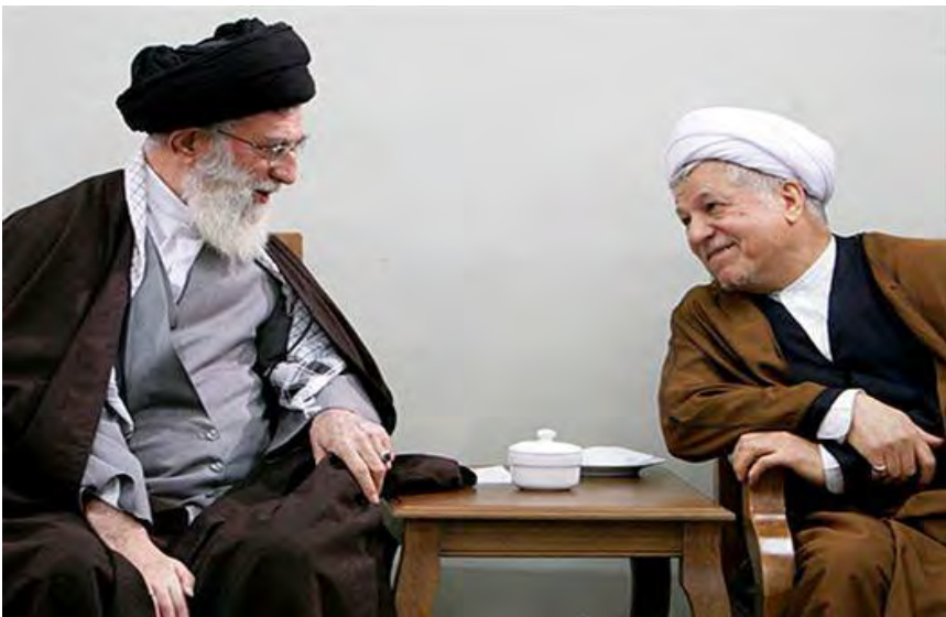
N: Teqî Rûzbêh W: Rûken

D estpêka qonaxêke pîrr ji evraz û nişîv, ku bi awayek berbiçav bi destbiserkirina zarokên