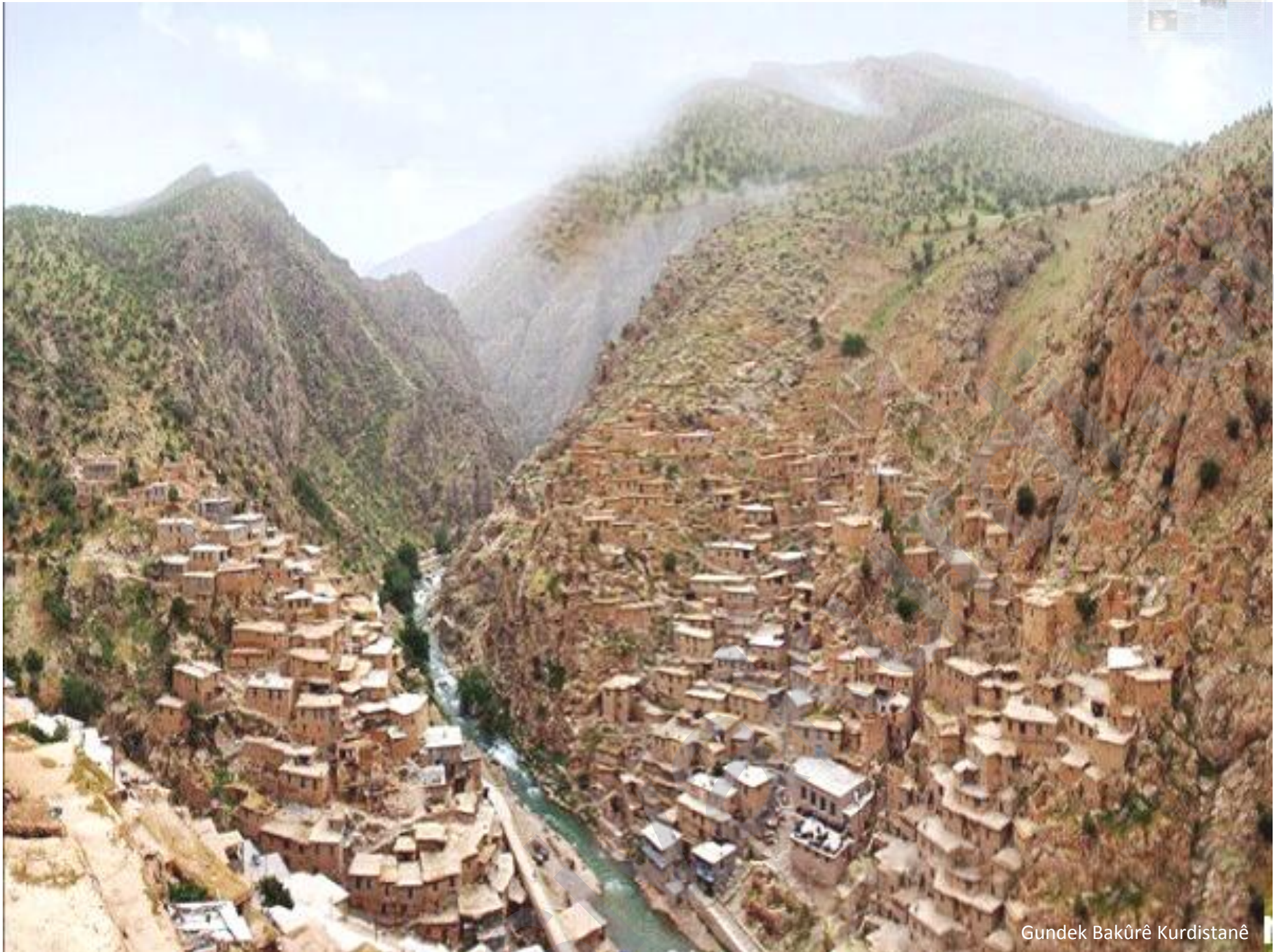
Gundek Bakûrê Kurdistanê