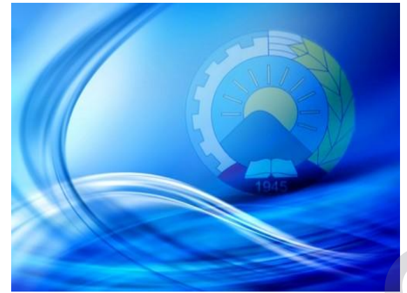
Partiya Demokrat a Kurdistanê Îranê Deftera Siyasî 7'ê Hezîrana 2012'an a Zayînî 18'ê Cuzerdana 1391'an a Rojî

Paartiya Demokrat a Kurdistanê Îranê, weke alîgirê hertimî yê mafên mirovan, piştewaniya xwe ji gaziya "Şirîn Îbadî" radigehîne û bi hurmet ve dinêre hewlên her aliyekê pêdagir li ser mafên mirovan di wê pêwendiyê de.