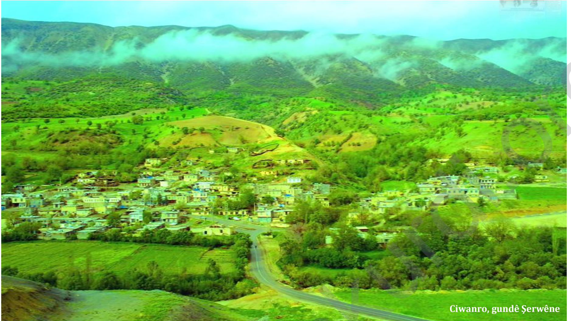
Ciwanro, gundê Şerwêne