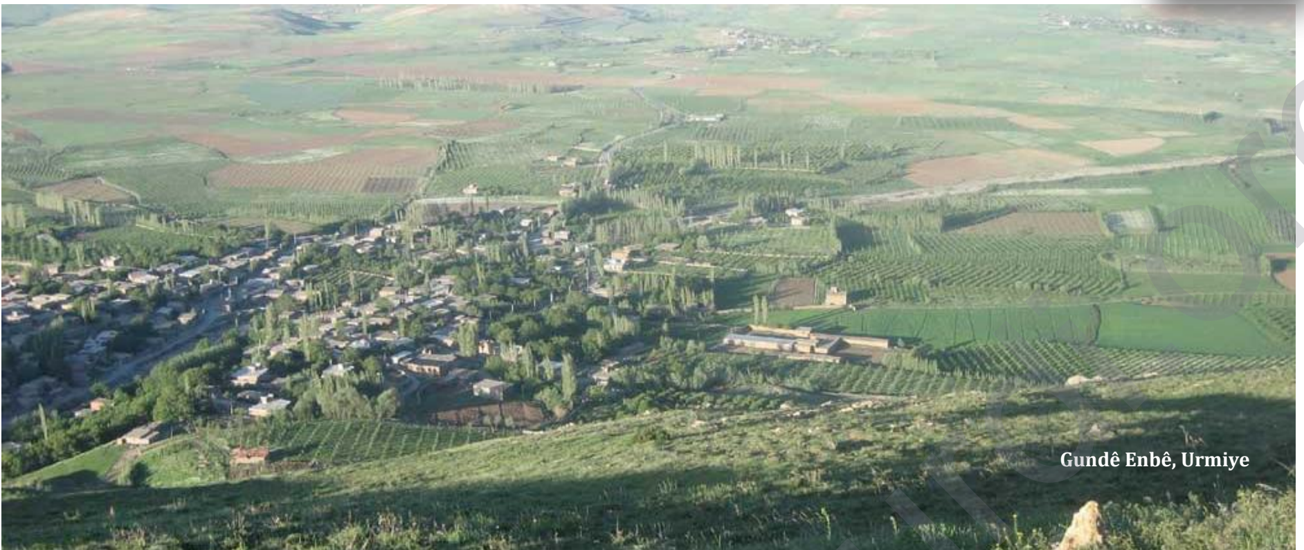
Gundê Enbê, Urmiye