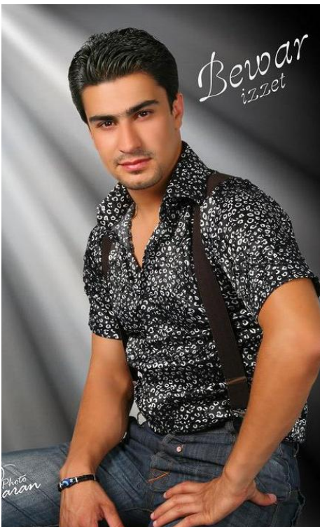
Hevpeyvîn: Ceifer Mubeşirniya