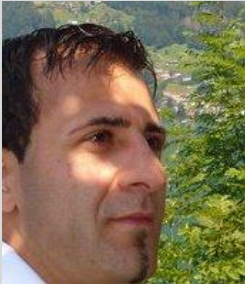
Senar Hatemi Swis

Xelkê zulmlêkirî û gelên mafxwarî yên Îranê, 32 salan berî niha li dijî zulm û zor, cinayet û hovêtiya sîstema paşatiyê rabûn û şoreşek birê xistin ku li dîroka hevçerx ya Îranê de bêminak e. Xelkê azadîxwaz, bivir ji reh û rîşalên desthilata paşatiyê xistin û dawî bi jîna wê anîn. Lê mixabin nezanîn ku hov û dêwek gelek xeter û metirsîdartir ji şahê Îranê dê wan bixapîne û xweşiyên serketina şoreşê ji wan tal û li difna wan de derbîne. Derhal Komek melayên xwînmij û çekçekûleyên şevperest dest dan hev û bi navê Komara Îslamî, deskevtên şoreşa gelên Îranê bi talan birin û li midehek gelek kurt de dîsan ewrên reş û tarî û dûrketî ji asîmanê Îranê, vegerandin ser asîmanê welat û zulm û cinayet, hovêti û bêdadî weke diyarî bi ser xelkê de barandin ku heya niha jî berdewam e.