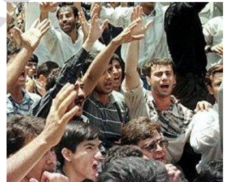
Nimûneyek ji xwenîşandana xelkê bajarê Sine

Niha piştî derbasbûna 11 salan bi ser wê serhildanê de, em dibînin ku rejîma Komara Îslamî li tengasiyek siyasî a diwarz de asî bûye û roj li pey rojê zêdetir dikewe bin givaşan û tê perawêz xistin. Lewre xincî alozî û kirîz afirandin, tepeserî û kuştina xelkê bêzorbûyî yê Îranê, tu tişteka din bo