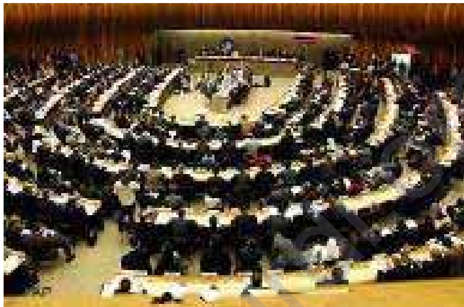
Komîteya Sêyem ya Rêxistina NY, roja Înê 29' Xezelwera 1388'ê Rojî (20'ê Mijdara 2009'an) bi derkirina biryarnameyekê, tepeserkirina xelkê û bînpêkirina mafê mirovan ji aliyê Rejîma Komara Îslamî ve mehkûm kir

Li çarçoveya van nigeraniyên cîhanî derheq rewşax navxweyê Îranê û pêpêskirina eşkere ya mafê mirovan ji aliyê rejîmê ve, Komîteya Sêyem ya Rêxistina NY, roja Înê 29' Xezelwera 1388'ê Rojî (20'ê Mijdara 2009'an) bi derkirina biryarnameyekê, tepeserkirina xelkê û bînpêkirina mafê mirovan ji aliyê Rejîma Komara Îslamî ve mehkûm kir û nigeraniya kûr ya xwe jî li hember van kiryarên rejîmê nîşan da û tede çend rasparde û daxwazî bo dawîanina bi