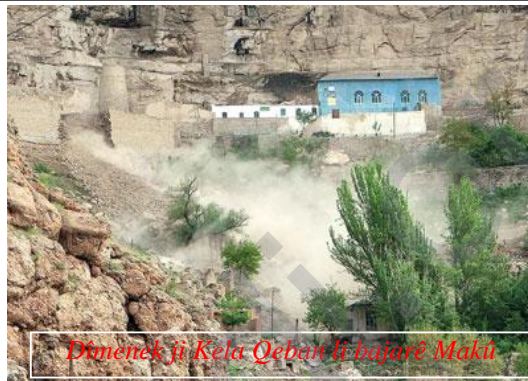
Dîmenek ji Kela Qeban li bajarê Makû

Rejîma Komara Îslamî a Îranê mizgeftêk di kêleka wê kelê çêkiriye û hewl