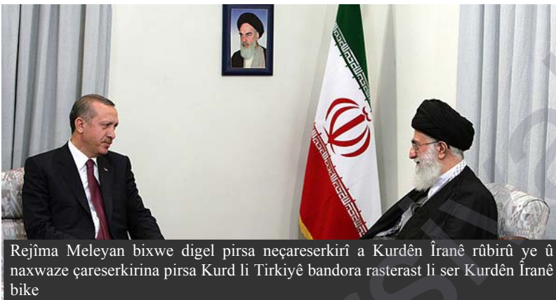
Rejîma Meleyan bixwe digel pîrsa neçareserkirî a Kurdên Îranê rûbirû ye û naxwaze çareserkirina pîrsa Kurd li Tirkîyê bandora rasterast li ser Kurdên Îranê bike

Piştgiriya Tirkîyê li programa navîkî a Îranê û rejîma Komara Îslamî û