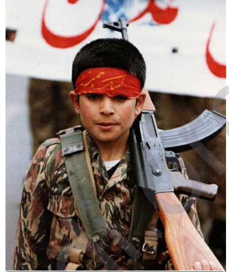
Rejîma Komara Îslamî a Îranê zarok wek amûr û alavêkê dizane ku hewce ye li gor hez û îdeolojiya rejîmê bilivîn û stûxwarê biryarên wan bin daku ji bo armancên xwe bikar bînin

Pêvajoya asayî û normal eva ye ku gişt zarok di hemû welat û sistemek perwerdeyê de bi awayekî demokrat û dûr ji çanda mirinperestî û şer bîn perwerdekirin û bihayên mirovî û aştîxwazane ku çanda bihev re jiyankirin û lêborîne ye, bi wan bê nasîn, da ku bibin xwediyê raman û nerînek mirovî û pozetîv li