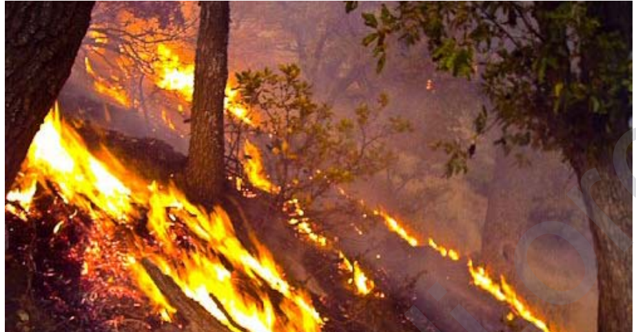
Li Kurdistanê bi hezaran hektar daristan di salê de tîrîşewitandin, lê çî alî û saziyeye Komara Îslamî a Îranê tuneye ku bo vemirandina agirê daristanên Kurdistanê gavan bavêje

Li gor rapora rêxistinên ne hikûmetî ên parêzerên jîngehê li Rojhilatê Kurdistanê, di sê mehên havîna îsal de, tenê li bajarên