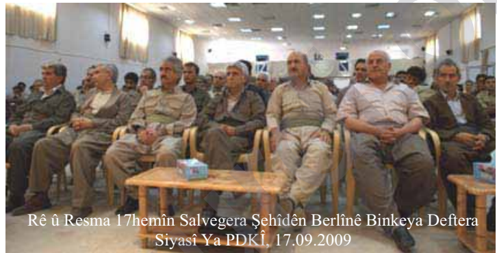
Rê û Resma 17hemîn Salvegera Şehîdên Berlînê Binkeya Deftera Siyasî Ya PDKÎ, 17.09.2009

Rêûresma 17hemîn salvegera şehîdên Mîkonosê bi xwendin û pêşkêşkirina çend sirûdan û pexşanekê bidawî hat.