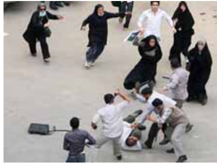
Dîmenek ji êrişa hêzên rejîma Îranê bo ser xelkê nerazî piştî encama hilbijartinan

dawî hat. Di vê hilbijartinê de ku pitir ji 470 kesan xwe ji bo Serok Komariyê berbijar kiribûn, ji aliyê Konseya Parêzvan ve tenê selahiyeta 4 kesan bi navên Mehmûd Ehmedînejad, Mêhdî kerûbî, Mîrhusên Mûsewî û Muhsên Rizayî hate erêkirin. Di nava van 4 kesan de 2 kes bi navên Mûsewî û Kerûbî xwe bi guhertinxwaz dan nasîn û dirûşmên guhertinxwaziye girtine pêş û du kesên din bi navên Ehmedînejad û Rezayî jî mohafizekar bûn: Em di vê nivîsarê de dixwazin zêdetir li ser bi nav guhertinxwazan bisekinin. Ger mirov bi başî zaniyarî li ser sîstema rejîma Komara Îslamî a Îranê tunebe, zû dê were xapandin. Ma ne raste ku çend sala berî niha jin û ciwanên Îranê bi dirûşmên derewîn ên Xatemi hatne xapandin. Jin û ciwanên Îranê bi hêviyek pîr mezin hem di hilbijartina serok komariya di sala 1376'an (1997) de û hem di sala 1380'an (2001) de beşdarî kirin hilbijartinan bûn û çûne ser sindoqên dengdanê. Helbet ne ji ber Xatemi, belku ew têniyê azadiyê bûn û Xatemi jî ew yeka bi başî dizanî û bi dana dirûşmên azadixwazane xelkê Îranê xapand û kişande ser sindoqa dengdanê. Di asta navnetewî de jî dewletên biyanî nemaze welatên Ewrûpî jî bi sedema vê yekê ku ji sîstema Komara Îslamî a Îranê zaniyariyên zaf tunebûn, Xatemi weke mirovek guhertinxwaz mêze dikirin û van jî bi hêviyek mezin peşwazî ji Xatemi kirin. Lê mixabin Xatemiye reformxwaz jî her weke axundên din dema ku hate ser kursiya