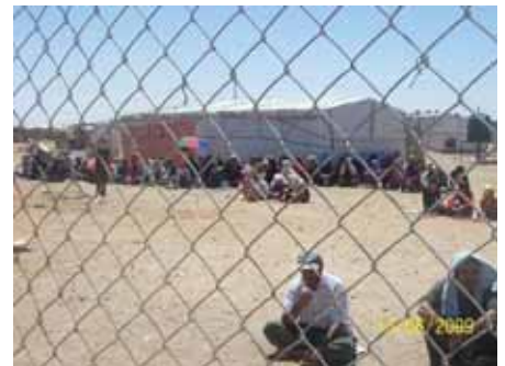
Dîmenek ji gireva penaberên Kurd ên Rojhilatê Kurdistanê li ser tixûbên navbera Îraq û Urdinê

Ji roja yekşem, 14ê Hezîrana 2009'an ve, 9 kes ji wan koçberan girev girtine. Hêjayî gotinê ye ku koçberên han nêzîkî 20 salan e ku di kampa Eltaş a Îraqê de dijîn û di destpêka sala 2005'an a Zayînî de bi sedema nebûna ewlehiyê û gefa girûpên tundrew û şovenîstên Erebi ji wan, bi armanca derbasbûnê, rêya welatê Urdinê dane ber xwe. Lê heya niha jî ne hukûmeta Urdunê îzna çûne nav wî welatî dide wan û ne Komîsariyaya Bilind a Koçberan ya Neyeweyên Yekbûyî hevkarîya pêwîst tevî wan dike.