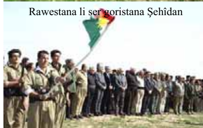
Rawestana li ser goristana Şehîdan