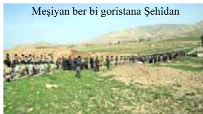
Meşiyên ber bi goristana Şehîdan

Bi vê hêviyê ku gelên Îranê di xebata berheq a xwe a li dijî dîktatoriya Wilayeta Feqîh de her çiqas zûtir serbikevin û Îran bibe ya hemû Îraniyan bi bicîhatina hemû mafên