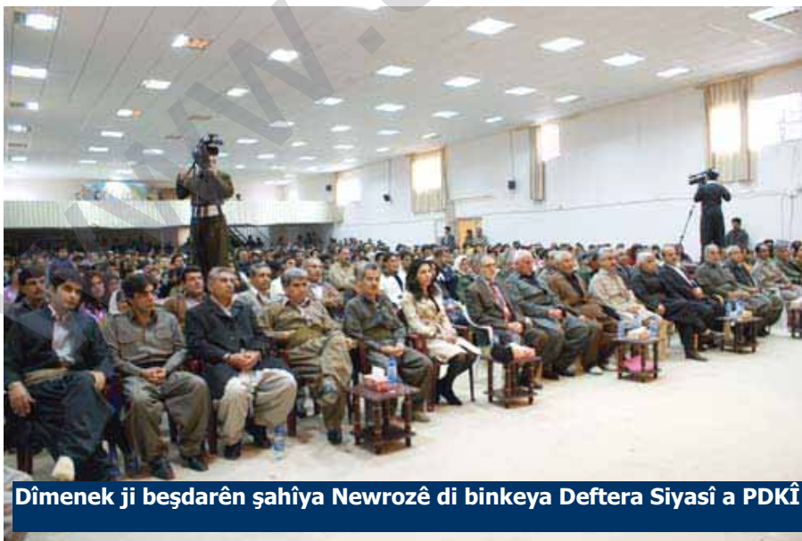
Dîmenek ji beşdarên şahîya Newrozê di binkeya Deftera Siyasî a PDKÎ