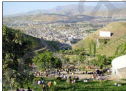
beşdaran ve hatin pêşkêşkirin.

Di rê û resma han de serbarê bilindnirxandina Roja Cîhanî a Jinan, çendîn gotar, helbest û sirûd ji aliyê