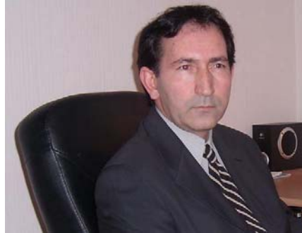
CAPK'Ê DIXWAZE BONA XURTKIRINA LOBÎYA KURD Û PÎRSÊN KURDISTANÎ DENGÊ XWE BÎDE BÎHÎSTANDIN