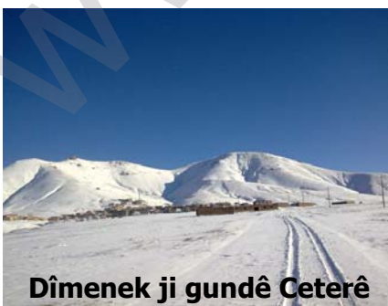
Dîmenek ji gundê Ceterê

Çavkanî: (Fehengî Ramiyarî Nîga) Azad Weledbegî (Danêşnamêyê Siyasî) "Political Dictionary" Daryûş Aşorî