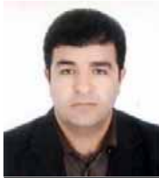
Ebdulrezaq Muradazer Kadroyê PDKÎ

Derçûna hejmara 100'an ji we û hemû xwendevanên we pîroz dikim û hêviya serkevtin û berdewamiyê bo we dixwazim.