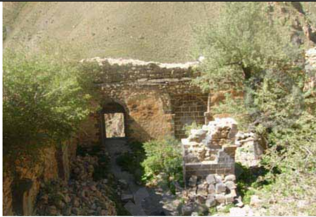
Dîmenek ji Kela Bêrdûkê

Hewce ye ku gelê Kurd bala xwe bide wan cure cihwarên dîrokî û bona parastina wan helwê bide, ji ber ku ew beşek ji nasnameya me ya neteweyî ne.