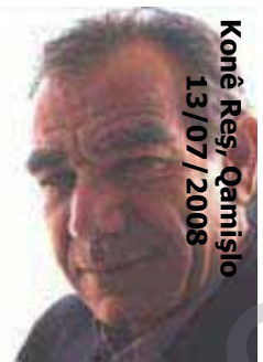
Konê Reş, Qamişlo 13/07/2008

R ewşenbîr; ilm, zanîn û serwestiya giştî ye. Mirovên rewşenbîr jî, ew mirov in ku di nav me de dijîn û serwestî piraniya cureyên ilm û zanîne ne û her dem û gav bi dûv zanîn û nûbûnê de dibezin da ku civata me bi rengêkî şaristanî û demokrati bi pêş keve û civata me di xweşî û şadiyê de derbas bibe. Erê mirovên rewşenbîr xwedî zanîneke giştî û têvele, wek: tore, bi tev cureyên xwe ve, dîrok, bi şaristaniyên mirovaniyên xwe ve, erdnîgarî, bi çiya û deştên xwe ve, civat û polîtîkî, bi fen û xapên xwe ve. Ango mirovên rewşenbîr ji her cureyên ilm, zanîn û toreyê dizanin û çiqas di zanîn û serwestiya xwe de kwîr û milevan bin, wiha ew ji rewşenbîrên rast û durist tene dîtin. Di vî warî de em nikarin kesên wek: Bijîjkan(Doktoran), bervedêran(Avokatan)û endezyaran ji rewşenbîran bibînin, eger ew di rewşenbîriya giştî de, bi rengêkî têvel ne milevan û serwest bin.