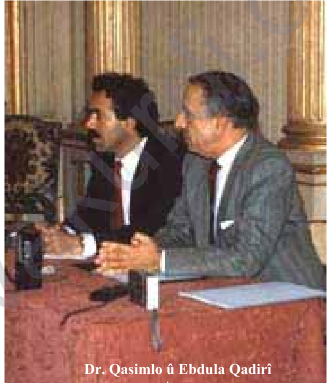
Dr. Qasimlo û Ebdula Qadirî