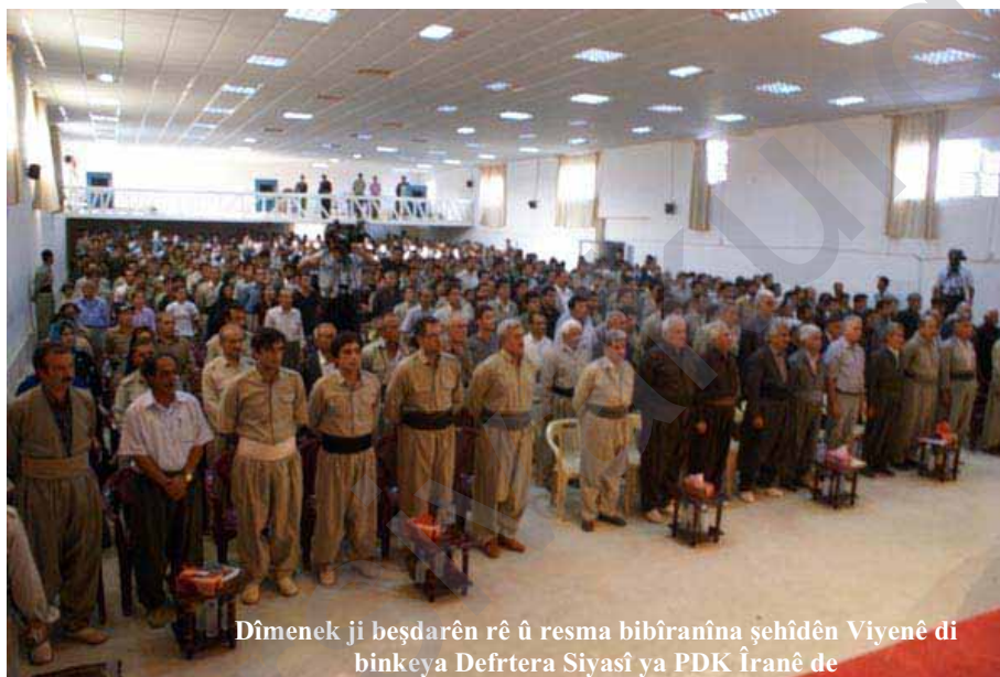
Dîmenek ji beşdarên rê û resma bibîranîna şehîdên Viyenê di binkeya Defrtera Siyasî ya PDK Îranê de

Dr. Qasimlo piştî derbazkirina wê qonaxê û domandina xebata siyasî, carek din bi sedema guhertinên siyasî ên Îranê û Kurdistanê ku berevajî hevî û xwezîyên Dr. Qasimlo bûye, tevî