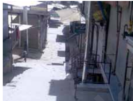
3 dîmen ji daxistina dikan û bazaran li bajarên Kurdistana Îranê bi boneya 19'hemîn salvegera terorkirina Dr. Qasimlo û hevalên wî

Ji bo tirsandina xelkê welatparêz yê Seqîzê ku sibêdeya îro 22'ê Pûşperê (12'ê Tîrmeha 2008), 3 helikopterên Kubra li esmanê bajarê Seqîzê digeriyan. Di şeqaman, cihên giştî û heta kûçeyên bajarên Kurdistanê de, hêzên bi tevahî çekdar û garda taybet hatibû cihgirkirin. Hêzên rejîma Xomeynî li bajarên Kurdistanê li hêcet û mihaneyekê digeriyan ku wê gireva nerzîbûn û şermezarkirinê serkut bikin û weke salên berê xwînê birêjin, xelkê Şehîd, birîndar û binçav bikin.