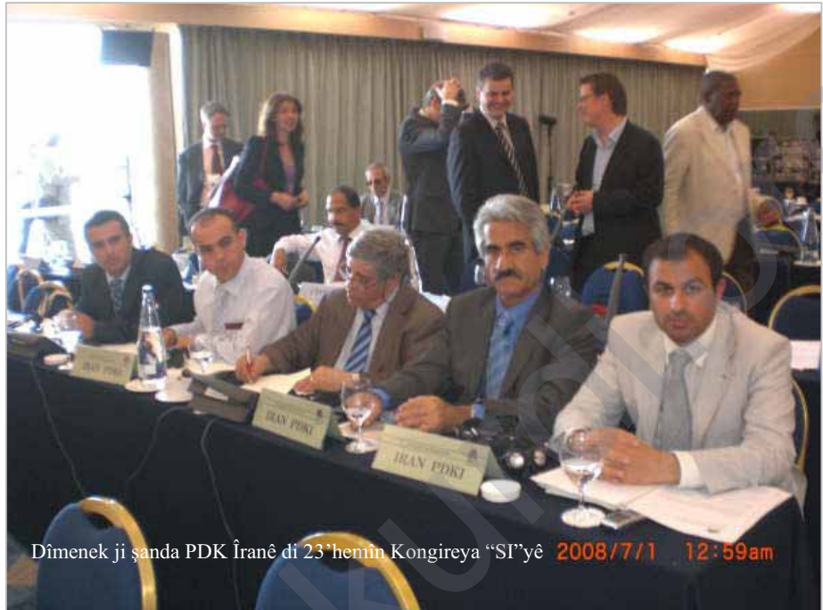
Dîmenek ji şanda PDK Îranê di 23'hemîn Kongireya "SI"yê 2008/7/1 12:59am