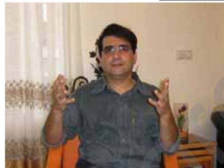
* lêkolîvan û nivîskarekî Rojhilatê Kurdistanê ye

- Di sala 1924'an de, di nameyekê de ji bo nûnerê Bîrîtaniyayê li Mezopotamiyayê, dinivîse: " Ez û Seyîd Taha sozê didin we