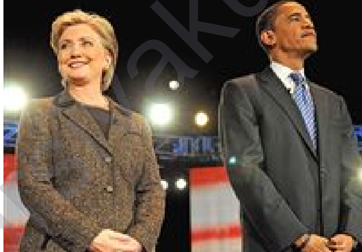
Berendamê/a Partiya Demokrat, Hillary yan Obama?

Heqîqet ew e ku cihê van sîsteman di vê dinyaya me de nîne û nabe hebe jî. Û herweha bêguman me kurdan jî dinyayek li gor dilê xwe divê ku di wir de cih û rola me kurdan bi awayekî zelal û xurt hebe. Em jî weku hemû milletên azad yên dinê xwedî mafên xwe yên