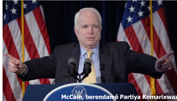
McCain, berendamê Partiya Komarîxwaz

Siyaseteke wê ji bo kurdan, hema bêje gellek zelal, heye. Ew dixwaze bingeha eskerên Amerîkayê ji Îraqê bibe li Başûrê