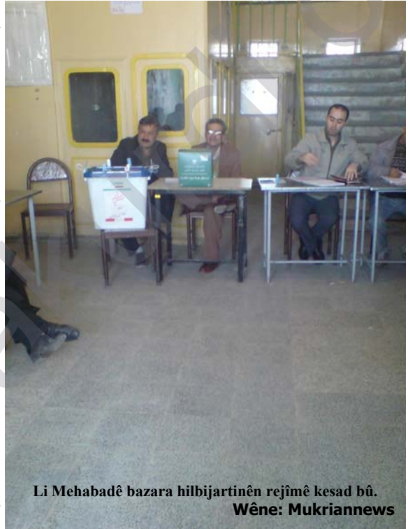
Li Mehabadê bazara hilbijartinên rejîmê kesad bû.

CNN'ê ragihand ku navendên dengdanê vala bûn û bi asteke kêmbû dihat dîtin ku xelk deng bide. Li gora raporekê ku li bajarên Urmiye û Mehabadê gihîştê Rojnameya Agirî, li vî bajarî xelkê bi kêmi beşdarî hilbijartinan bû û nîfûsek kêmbû a xelkê li ser