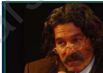
62. salvegera damezrandina Komara Mehabad bi rêya Rojnameya Agirî, li her kurdî dikim

Bo min zarokeke ku `kenê wî lê bibe girî` ye navê Mehabad!