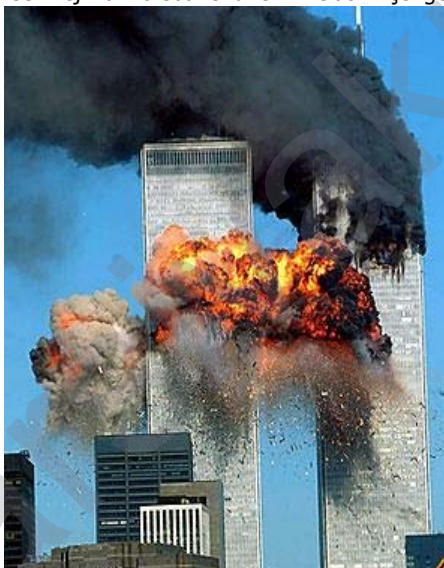
em dikarin 11'ê Îlona 2001'an, destpêka niqte guhertinek kûr û bîngehîn di dîroka siyasî a cîhanê de bihesibînin

hêcetek bo destpêkirina şerek mezin û cîhanî li dijî rejîmên totalîtar, dîktator û piştevanên terorîzmê li deverê û bi taybetî di Rojhilata Navîn de. Ji ber ku Rojhilata Navîn make û hêlûna bîr û ramanek kevn û dijî mirovî bi navê teror û terorîzmê di bin sîbera Radîkalîzma Îslamî de ye. Lewra xwezayî ye ku ew devera dê dibe qada şer û rikeberanêya navbera her du eniyan. Em dibînin ku agirê wî şerî heya niha jî dîtîyê û hemû dever dagirtîye. Me dît ku yekem dijîkiryara piratîkî li hember wê bûyerê ji aliyê Amerîka û hevalbendan ve li Efxanîstanê de serî hilda û rejîma Taleban û girûpa El Qaîdeyê bi sebebkarên bîngehîn yê wê cinayet û tirajîdyayê dane nasîn û di midehê kêmtir ji mehekê bi ser bihurîna 11'ê Îlonê de, bereya dijî terorê êrîş kirine ser rejîma Talebanê û ew welat li çengê