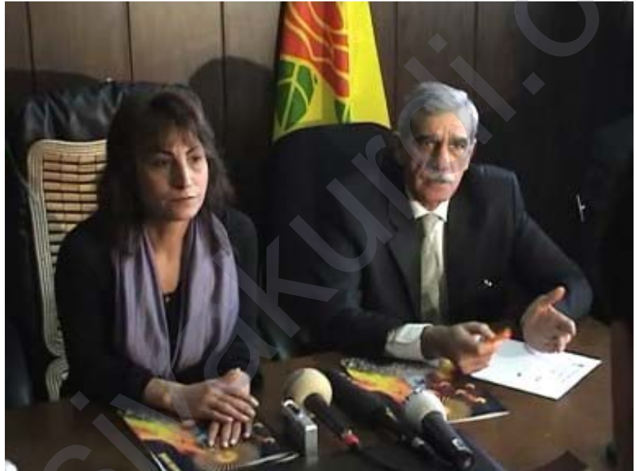
Partiya Civaka Demokratîk (DTP) dixwaze pirsgrêka Kurd li Turkiyê ji rêya aştiyane û demokratîk çareser bike

Lê bersiva neron û ne zelal ya Ebdula Gul, bi daxwazên Koma nûnerên Kurd ên DTP'ê li Parlemanê bû sedema vê yekê ku Koma Kurdan di gerra sêyem a hilbijartina