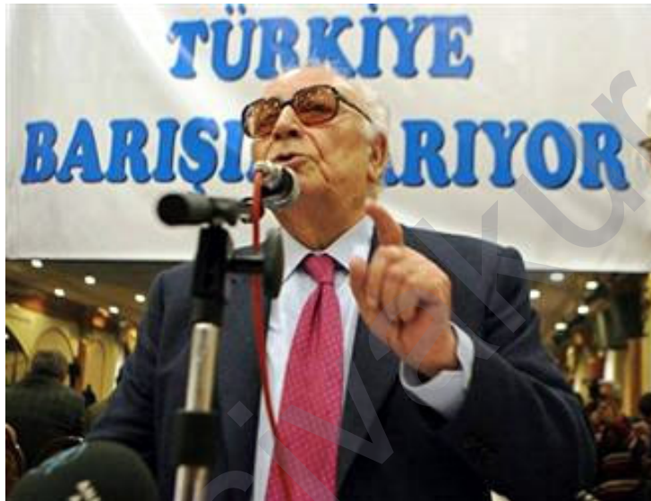
Yaşar Kemal: "Di sala 1923 Ata Tirk soza otonomî da Kurdan"

Yaşar Kemal, bal kişand ku hin derdor ji gerîla re dibêjin terorîst û wiha axivî: "Di vî şerî de, ji gerîlayan re gotin terorîst. Ji vê yekê jî hêvî dikin. Ewropayîyan jî ev yek fêm nedikirin. Digotin qey ev şer maceraya ciwanan a gerîlatiyê ye. Lê îro çapameniya cihanê hemû tiştî dizane. Ger ku ev şer dewam bike, dê ev şer Tirkîyeyê birizîne. Kes dê nikaribe ji binê vî şerî derkeve."