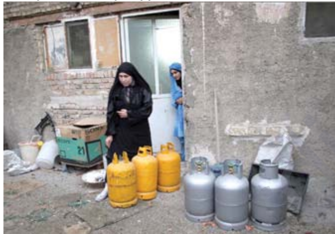
Pîrsgirêka şewatê li bajarên Kurdistana Îranê jiyana xelkê bi dijwariyan re berbirû kiriye

axa welat li herêmê de jî belav bûne, ne wisan e ku dengê gemî û tankerên niftkêş ên Îranê li erd û esmanan de xev li çavên lorîkên şîrmij jî