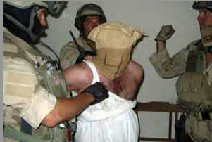
Telîs li serê sixorê Îranê hate xistin

Şeva çarşem, 11.01.2007'an hêzên Amerîkayê piştî haydarbûn ji hebûna şandeke Spaha Pasdaran û hêzên Îstixbarata Komara Îslamî a Îranê li binkeya wan ya li Hewlêrê, seet 3'ê şevê avêtin ser wê binkeyê û hemû kesên ku tê de bûn, bi xwe re birin. Her wiha gelek belgeyên terorîstî û sixoriyê li wir bidest xistine.