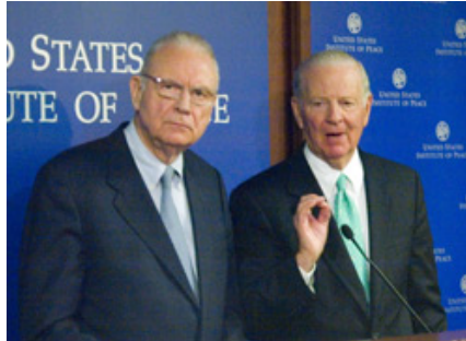
Rapora "Baker – Hamilton" tevî nerazîbûna xurt ya Kurdan berbirû bû

û xuya ji bo dîtîna ramanên welaî cîran di der barê Îraqê de hatiye dayîn ku eva jî tevî baldan bi helwesta welaî cîran, li hember demokrasî li Îraqê û misogerkerina mafên Kurd di vî welaî de dikare him ji bo çarenivîsa Îraqê û him mafên Kurdan û aliyên din yên Îraqî bi tirs û xeterê re rû bi rû bike ku