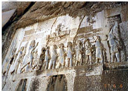
Bêstûn li 30 kîlometriya Rohhilatê bajarê Kirmaşanê hilketiye

Rêxistina Yoneskoyê ev mijare di bere berê sêyemîn civîna Komîteya Mîrata Cihanî ku di