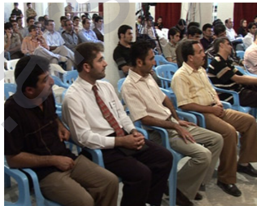
Dîmenek ji beşdarên semînara "Fêrbûn Di Mekteba Dr. Qasimlo Da"

YXDK Îranê roja sêşem, 27.04.1385 (18.07.2006) an, ji bo