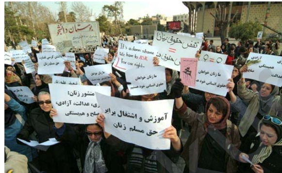
Xebata jinan li Îranê ji bo bidestxistina mafên mirovî ên xwe berdevam e, lê desthilatê ew bê bersiv hêlane.

Mixabin Komara Îslamî di Îranê de rêyê nade jinan ku di berhemanîna civakî de pişikdar be, belkî ew ji hemû mafên mirovî, siyasî, aborî, civakî,