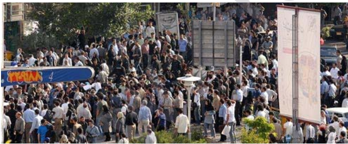
Xwenîşandana jinan li Tehranê di roja 12.06.2006'an de

Roja duşem, 12.06.2006'an, bi beşdariya nêzik bi 5000 kesan, meş û xwenîşandaneke aştîxwazane ya jinan di qada "7 Tîr" ya Tehranê ji bo xuyakirina nerazîbûna xwe li hember bînpêkirina mafên jinan û qanûnên dijî jin yê Komara Îslamî hate lidarxistin. Meşa han bi xurtî ji hêla hêzên taybet û ewlekariyê yê dewleta Îslamî ya Îranê hate tepeser kirin. Li gorî raporên ku ji Tehranê hatine belavkirin, hêzên rejîmê bi awayekî hov û dijwar li jinan dan. Tê gotin ku bi dehan kes û