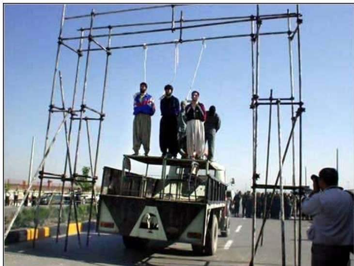
Wêneyek ji dema îdamkirina hovane ya 3 ciwanên Kurd li Îranê

Z êdebarê hemû zext û givaşên navneteweyî û nerazîbûna Rêxistina Mafê Mirovan a Navneteweyî, hejmara kesên ku di Îranê de tîndalîandin, sal bi salê zêdetir dibe.