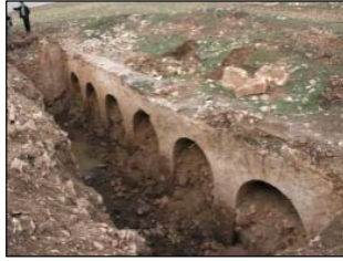
Girikê hezar salî yê dîrokî ku li Amedê hate peyda kirin

riya gundê Boşat a ser bi devera Farqîna Amedê li herêma Rêya Sor , rastî girikek hatine. Girik, di encama xebatên kolandinê ku bi wesayîten kar hatine kirin derkete holê. Şaredarê