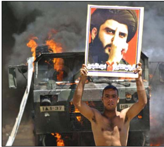
Îran piştevanî û alîkariya girûpên terorîstî li Îraqê dike, çek û teqemeniyên bo nava Îraqê dişîne

Di vê navberê de çendin caran tiliyên tawanbariyê bi terzekî berfireh, piştî hîloşîna rejîma Bees, ji aliyê Amerîka, Bîrîtaniya û hin welatên Erebi ve bi meytêkirin di kar û barên Îraqê bo aliyê Îranê hatiye dirêj kirin. Îran bi dest hebûn di terora çend berpisiyarên Îraqê û piştevanî kirin ji girûpên terorîstî hatiye gunehbar kirin, lê niha şîdet û rijdiya van êrîş û tawanane di rewşeka wiha hesas û dijwar a Îranê û di asta navneteweyî de, yê bûye sedema yê yekê ku ev pîrsa bibe bi mijarek girîng û balkêş di rojeva cîhanê de. Vê mijarê alîkariyek zaf û xurt da bîr û raya wan kesan ku li ser vê baweriyê ne Komara Îslamî dixwaze rewşa Îraqê aloz û bi qazanca xwe biguherîne û bandora xwe li ser guhartinên siyasî ji rêya mizextina pareyek zaf û hinartina bi hezaran kes ji