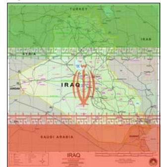
Armanca Îranê alozkirina rewşa tenahiya Îraqê ye û dijî prosesa azadî û demokrasîyê di Îraqê de dixebite.

Îslamî jî desttêwerdan di kar û barên hundirê Îraqê di gava yekem de, kêmkirina zext û givaşên cîhanî li ser xwe li dor programên navikî yê xwe ye. Duyem, sergêjî, bendewar û mijûl kirina Amerîka û hevalbendan bi pîrsên Îraqê jî bo manordana pitir a xwe. Sêyem, piştevanî û avakirina hikûmetek nû bi desthilatdariya Şîiyên cihê baweriyê xwe. Çunkî Şîiyên tunrew û malbata Elhekim berê jî ji siyasatên Komara Îslamî bi dijî Sedam Husên piştigîrî dikirin û piştî nemana rejîma Bees jî, heta niha li bin kargerîya siyasatên Îranê de bûne û çendin caran jî tawanên ku rastî Îranê li dor maytêkirin di kar û barên Îraqê de dahatin, red û bê bingeh hesabandine.