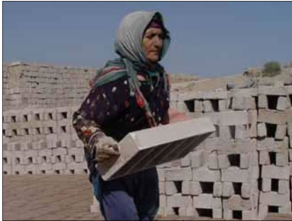
Jiyana Jinên kedkar di kûrexaneyên Îranê de gelek dijwar e.

Kar kirin di kûrexaneyan de serbarê vê yekê ku kareke şev û rojî ye û di holeke gerim û di