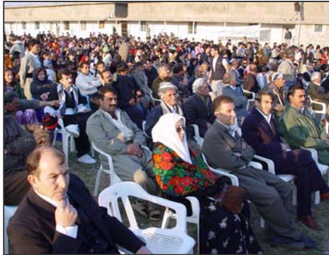
Wênayek ji beşdarên şahiya Newroza 2006'an, li binkeya Deftera Siyasî ua PDK Îranê

Kurd û partiya wê ya pêşeng, PDK Îranê wek hergav di êniya azadî, demokrasi û aştîyê de ne, lewra wezîfa ser milê me ye ku bi amadebûna zêdetir û baweriyê qahîmtir, hevalbendî tevî neteweyên din û cîhana pêşverû vê dijberiyê bidomînin, heta wê dema ku em siya giran ya vê rejîmê li ser xwe û giştî cîhanê ji holê rakin û hikûmeteke hilbijartîya gel li cihê vê ava bikin. Xuya ye di vê xebatê de hemû şêrejin, xwendekar, kedkar, ciwan û bi giştî tev tex û qatên hişyar û zana yê welatê me bi me re ne û ya ku bêtir ji jar dibe, Komara Îslamî ya Îranê dibe. Di vê xebatê û dijberiyê de serkewtin ji bo gel û neman ji bo dijî geliyan e.