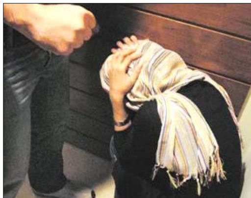
Di qanûna 36 welatan de ferq û cudahîdanan bi dijî jinan heye

Li gorî vê raporê newekheviya di mafan de, bûye sebaba vê ku jin ji îmkanatên berxwedanî tevî cudahîdananê ku di hemû warên jiyane de pêve dinalin, bêpar bin.