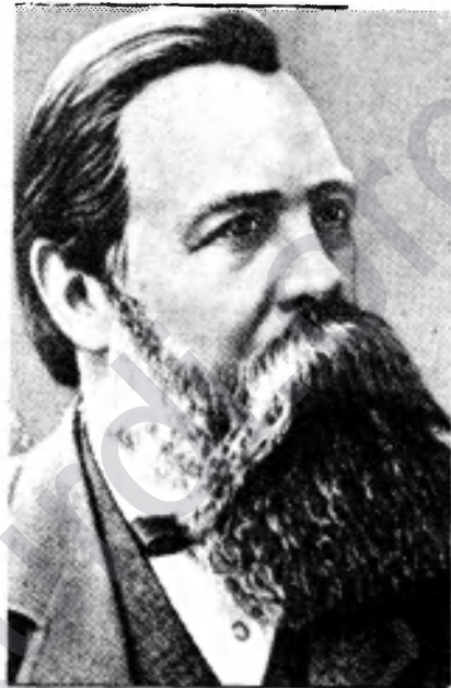
F. ENGELS (1820-1895)

1. Hê di dawiya sedsa la X a de, lê bi hîmtî di sedsala XI a de, li Almanyê "tevgerekt bajarvanî" tê dîtin. Bajarok, bajar û şaristanên nûza, yê ku heta hingê di bin nîrê abort û hiqûqî yê began de bûn, digîhên hev, hevdesaz dibin jibo bidestxistina a zadiya xwe (coniuratio civium an Schwurverband). Kel û dizên pêşîn (dtwar, paşê sûr: Pfahlbau, Stadtmauer) nîşanên serxwebûn û xweseriyê (otonomiyê) li Almanyê ji sedsala XI a ne; niha jî pirticar ew di derefsên şaristanan de xuya ne (nîşeya Engels).