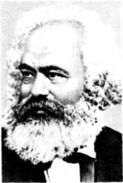
KARL MARX (1818-1883)

Ji serfên heyama navîn rûniştevanên komava (kommun) yên pêşîn zan; ji vê gel haya (xelkê) bajarî peyayên yekemînên bûrjûwaziyê derketin. 1