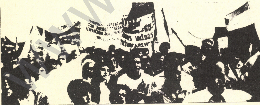
ARJANTİNDE DEMOKRATİKLEŞMEYE DOGRU GİDEN YOLDA YAPILAN KİTLE GÖSTERİLERİNDEN BİR GÖRÜNÜMÜ

Bu arada, Falkland adaları sorunu, Batı Avrupa'yı ve özellikle ABD emperyalizmini yeni sorunlarla, mütefikleri arasında güç tercihler yapma zorunluluğuyla yüz yüze bıraktı. Anlaşmazlığın ilk günlerinde arabuluculuk üstlenen ABD, gerçekten bir tarafsız arabulucu gibi davranmamış, İngiltereden yana tercihler peşinde koşan bir arabuluculuk görevini üstlenmişti. Her iki ülkenin savaş eşğine