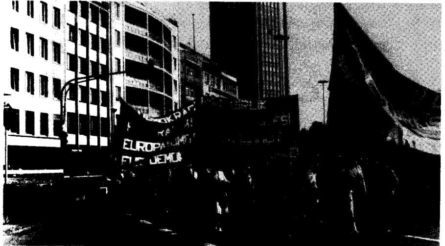
DİB-FAK'ın Almanya'daki eylemlerinden biri

Gelişmeler,ülkemizde artık faşist diktatörlüğün kurumsallaştırılması aşamasına geçildiğini gösteriyor.Türkiye Cumhuriyeti,açık faşist devlet anlayışına göre yeniden biçimlendiriliyor.Halen beş kişilik cuntanın arka arkaya çıkarttığı anti-demokratik yasalar, bir süre sonra kurulacağı ilan edilen kurucu meclis tarafından sistematize edilerek,faşist devletin anayasası da kaleme alınacak.Yeni den göstermelik bir parlamenter rejime geçilmesi mümkün;özellikle Türkiye işbirlikçi sermayesinin Avrupa Ekonomik Topluluğu'na entegre olma hesapları içinde "parlamentosuz rejim" önemli bir engel olacağı için,eninde sonunda "parlamenter bir görüntü" yaratmak zorundalar... Ancak bu, işçi sınıfının ve Kürt halkının temel hak ve özgürlüklerinin ayaklar al