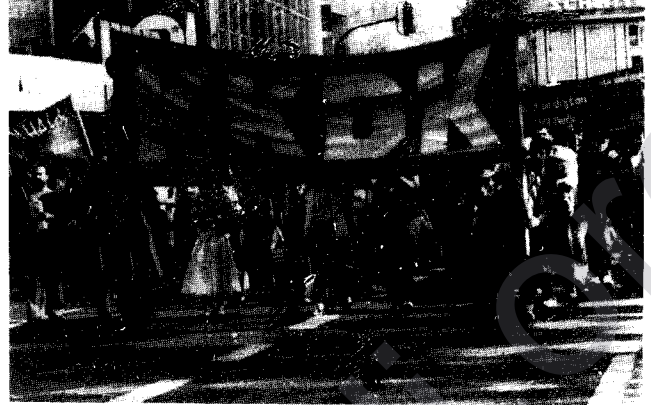
KKDK'nin kitlesel eylemlerinden bir görünüş

Lı bajarê Bochum, komita piştgi riya diji emperyalizmê (ASK)ber bî sazûnê ve diçe. Her rêxistin û komikê diji emperyalizmê dîkarrın cihê xwe tede bigrîn. Heya nî ha nêzîki 20 (Bist) rêxistin, parti û komik cih tede girtine.