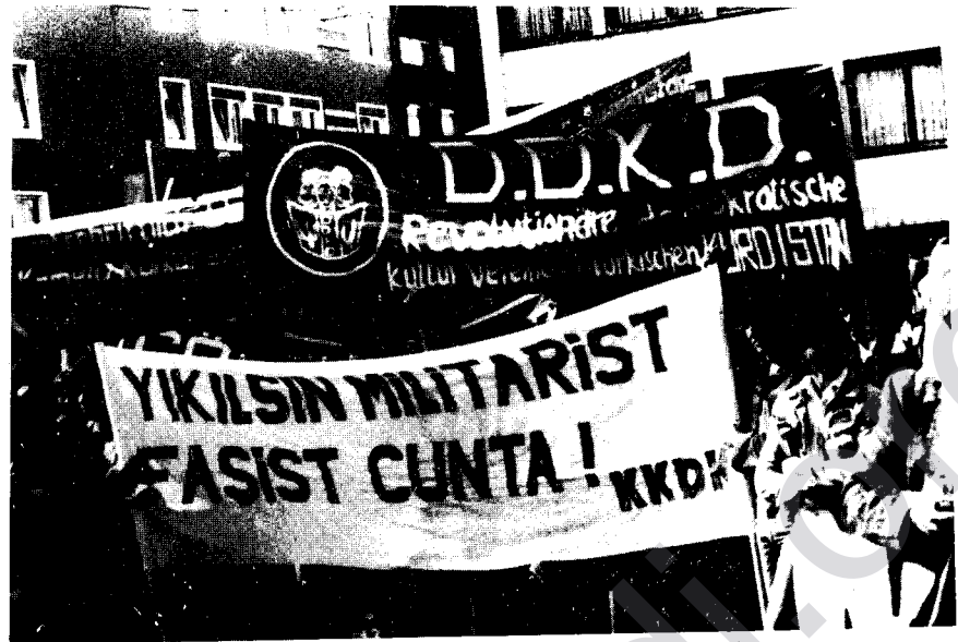
KKDK korteji Cuntayı protesto yürüyüşünde