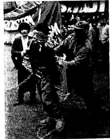
(TİRÊJ tiyatro grubuyla ilgili Alman gazetelerinde çıkan kâpür)