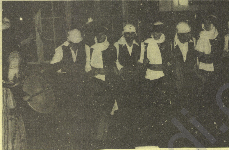
GRUPP GOVEND-DİYARBAKIR FOLKLORUYLA GECEMİZİ ŞENLENDİRDİ

Gecemizin sonlarına doğru, Davul ve zurnaya konukların büyük bir kısım eş lik ederek, NEWROZ'u kutladılar.