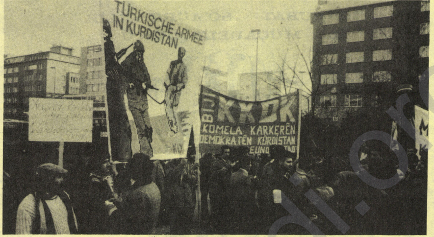
KÖLN YÜRÜYÜŞÜNDE KKDK KORTEJİ.