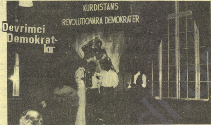
KOMİKA MİZİK YA KOMELA ME

Dawîya şevê disa bî leyîstîkên jî der û dora bajarê Amed (Diyarbakîr) hat. Mîvanan tev de govendê geşkîrîn.