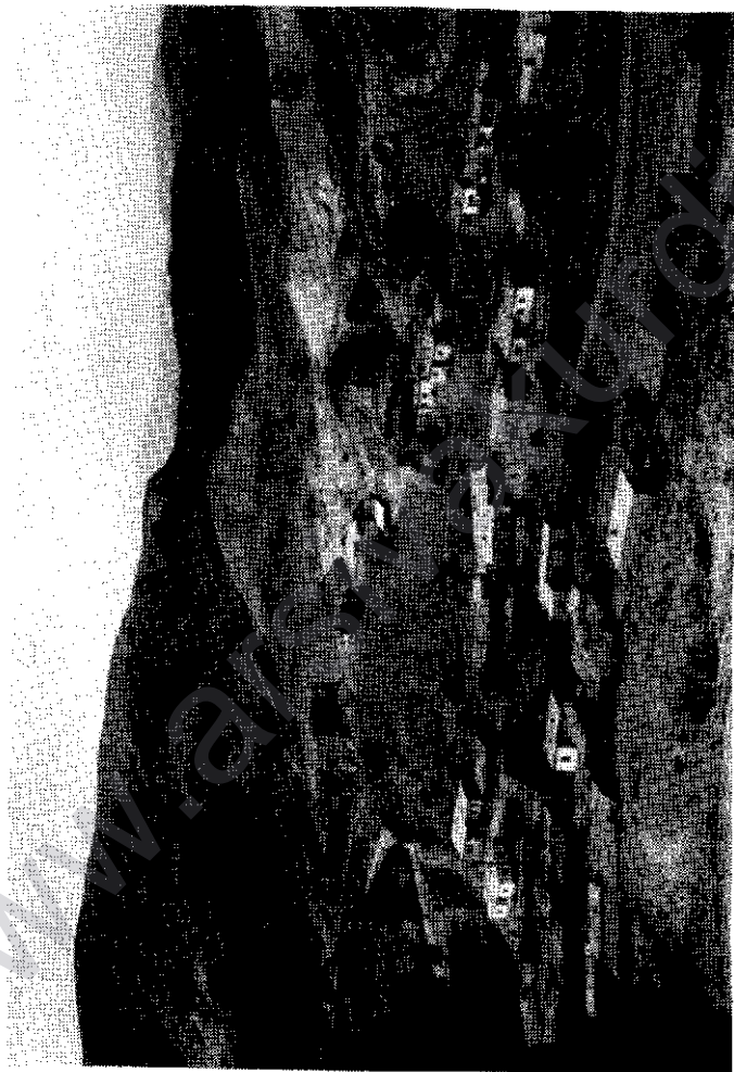
Welatra zu d'wě...