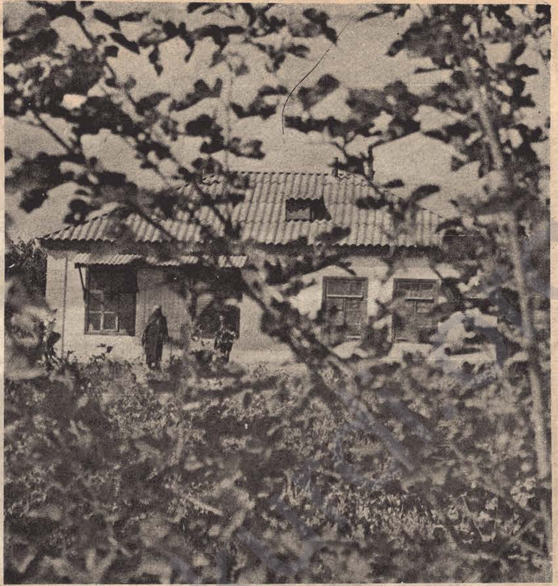
Sosyalizm Çiftliğinde bir köylü evi...

Nari, eğlence ve kültür işlerinde çiftlik yöneticisinin temsilcisidir.