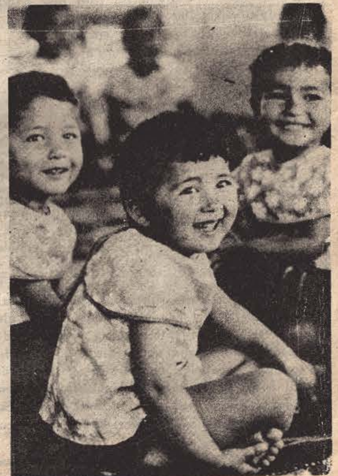
Çiftliğin anaokulunda çocuklar...