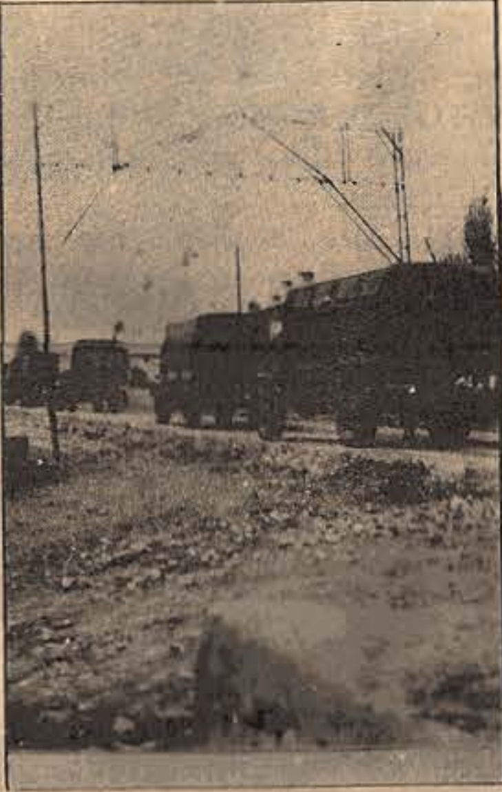
"Operasyon'a gidiliyor. Arkadaki araba boş, ama diğerlerinin perdesi çekili, içleri komando dolu..."

Türkiye de faşist bir dikta kurmak isteyen Tekelci Burjuvazinin iktidarı 2. MC, Kürt ve Türk işçileri üzerinde sömürü mekanizmasını son haddine vardırıarak, işletmektedir. Bunun en güzel örneği, kazamız ergani'de Aksa İnşaat Kollektif