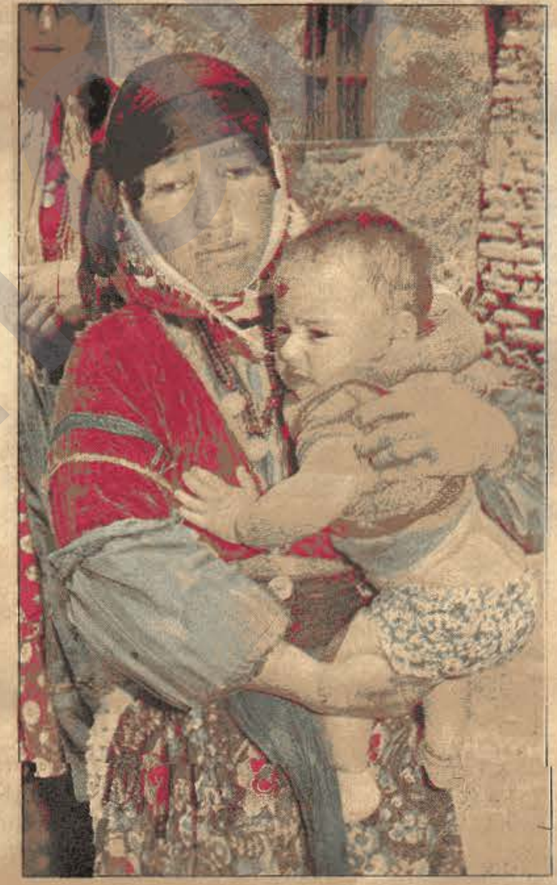
Eğitimsizlik Kürdistan'lı çocukların geleceği olmayacak....

MC döneminde alelacele çıkarılan ders kitaplarında bu şovenizm ve ırkçılık daha da hızlandırılmıştır. Bozkurt resimleri kitapları süslemekte, ergenekon masalları daha da futursuzca, genç beyinlere bir gerçek gibi sunulmaktadır. Millî Eğitim Bakanlığınca çıkarılan, desteklenen pek çok yayında, örneğin çocuklar için çıkarılan "Yavru Kurt" dergisinde, insanların, daha çocuk yaşta ırkçı motiflerle, şovenizmle, başka halklara karşı saldırgan duygularla şartlandırılmaktadır. Bütün bunlardan amaç gençliği ve insanlarımızı toplumsal sorunlardan ülke gerçeklerinden uzaklaştırmak; onları, emekçi