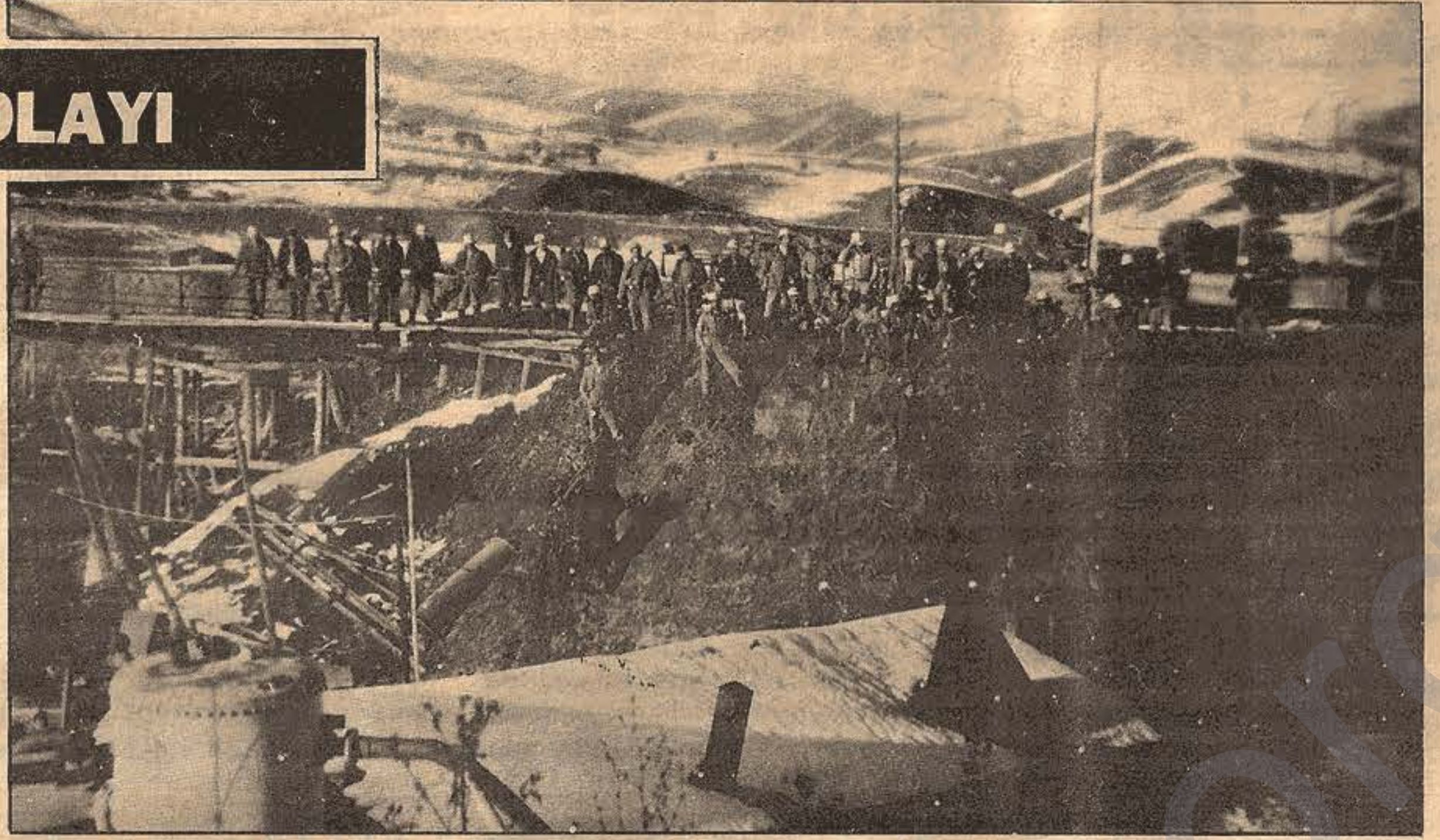
Aşkale'de Maden işçileri; tüm oyunlara karşı direnişleri başarıyla sürüyor...