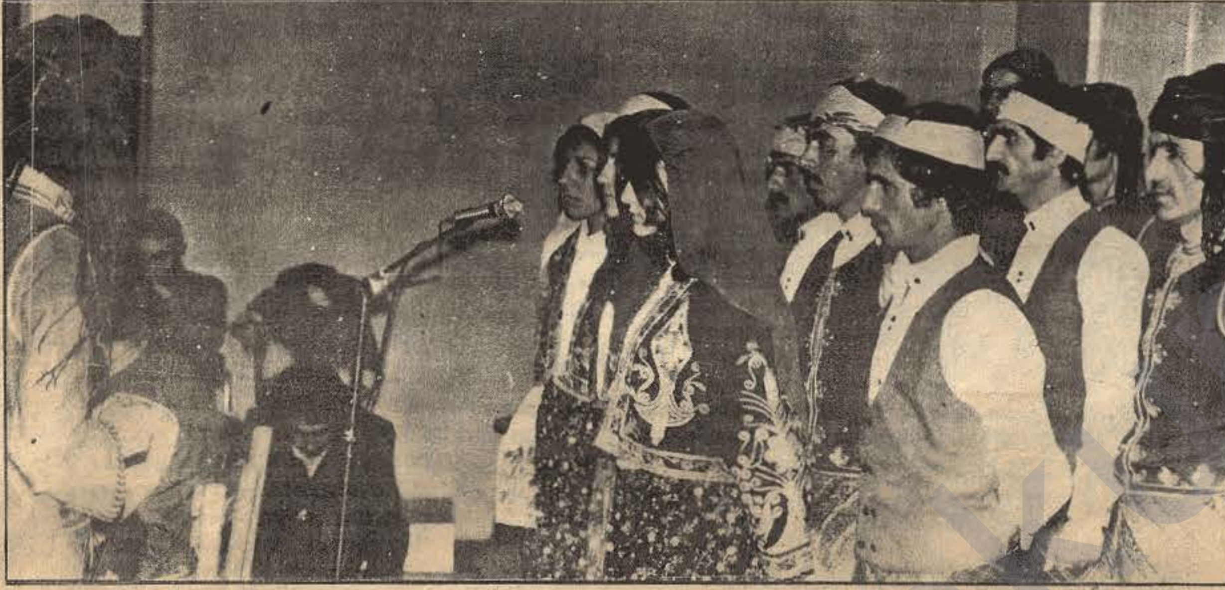
DHKD'nin korusu, Devrimci marşlar ve türkülerle geceye renk kattı.

rimci, demokrat bir doğrultu kazanmasını engelliyor. Diğer yandan umut verici gelişmeler de var. Kitlelerden kopuk, kendi başına, serüvenci, bireysel teröre yönelik eylemlerin başarı şansı olmadığı deneylerle de