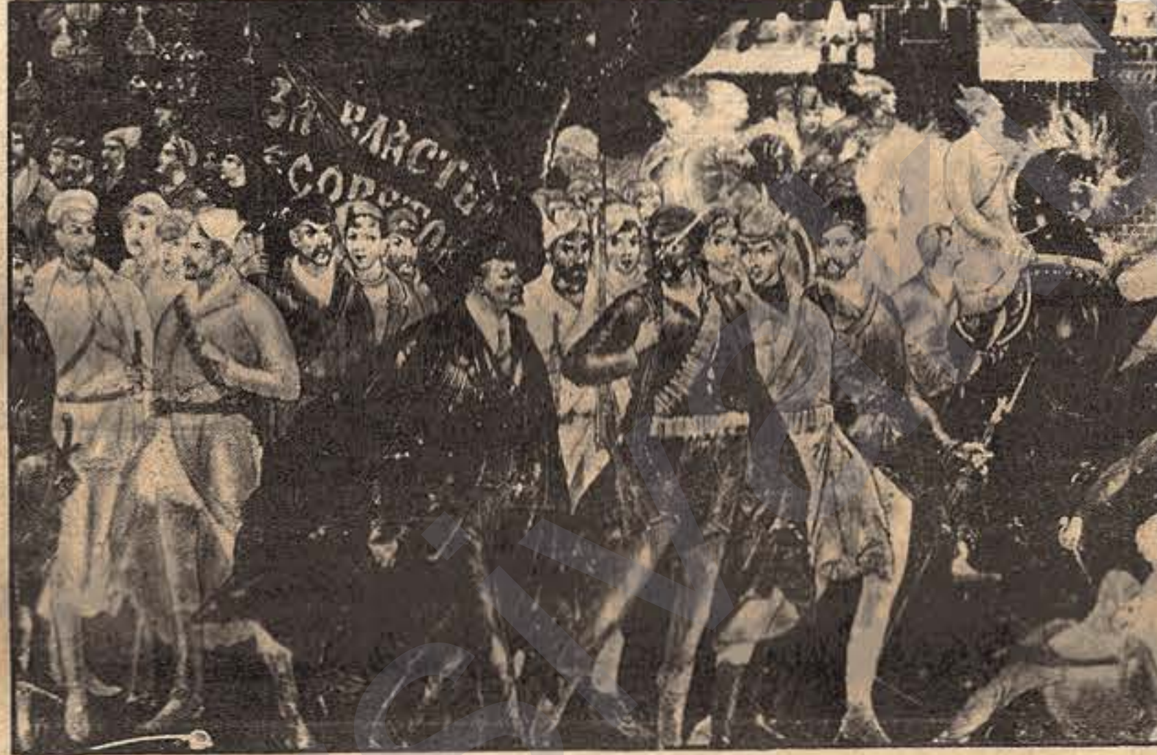
Lenin, Li Meydana Sor millet ra xeberide.