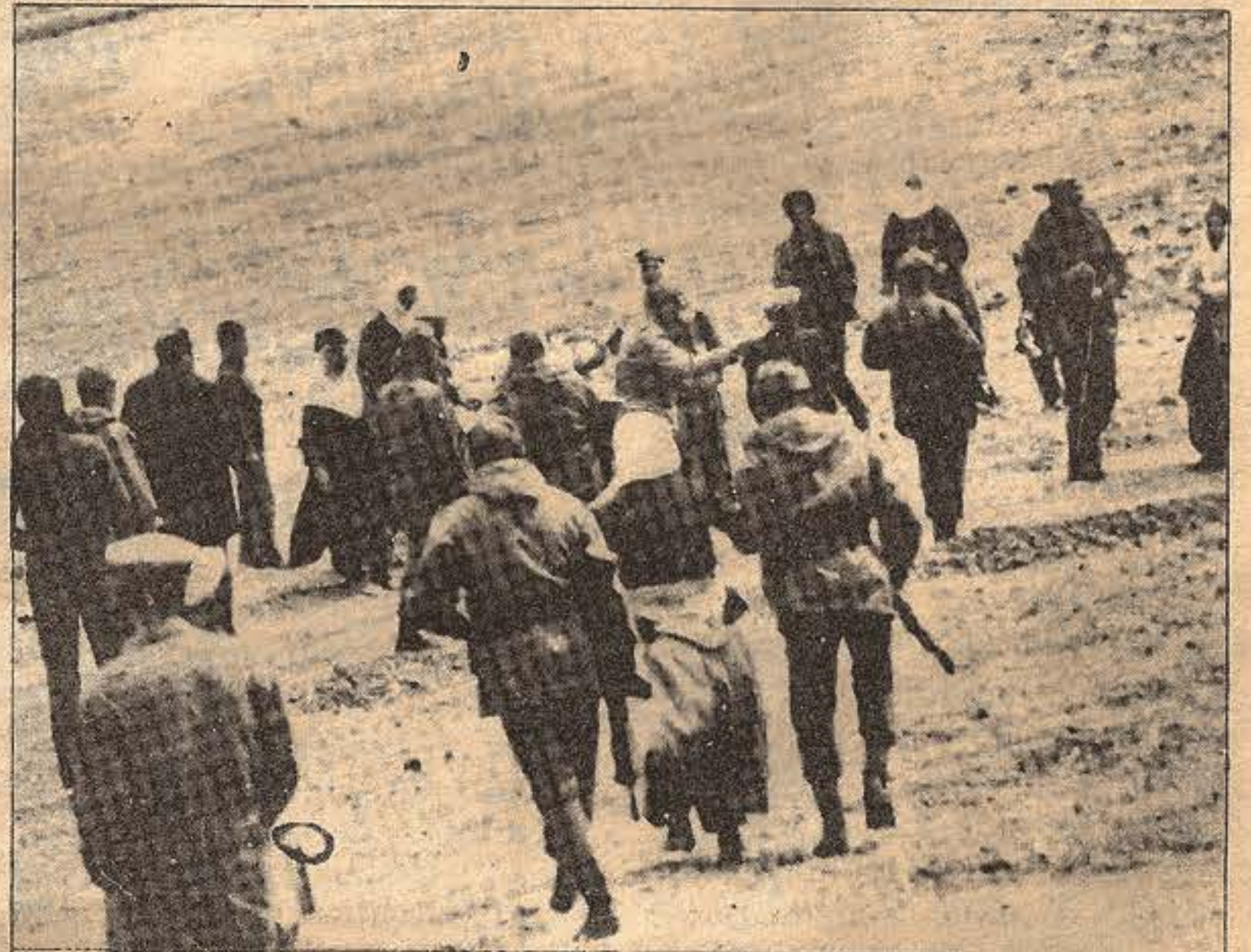
Bu fotoğraf bir savaş alanını göstermiyor. Bu, Kürdistan'da hergün rastlanan olaylardan biridir.

İşte bu örnekler, sözkonusu 20-25 dakikalık, süratın, "havadan ve karadan" müdahalenin ne işe yaradığını açıkça gösteriyor. Ve bunlar, bu