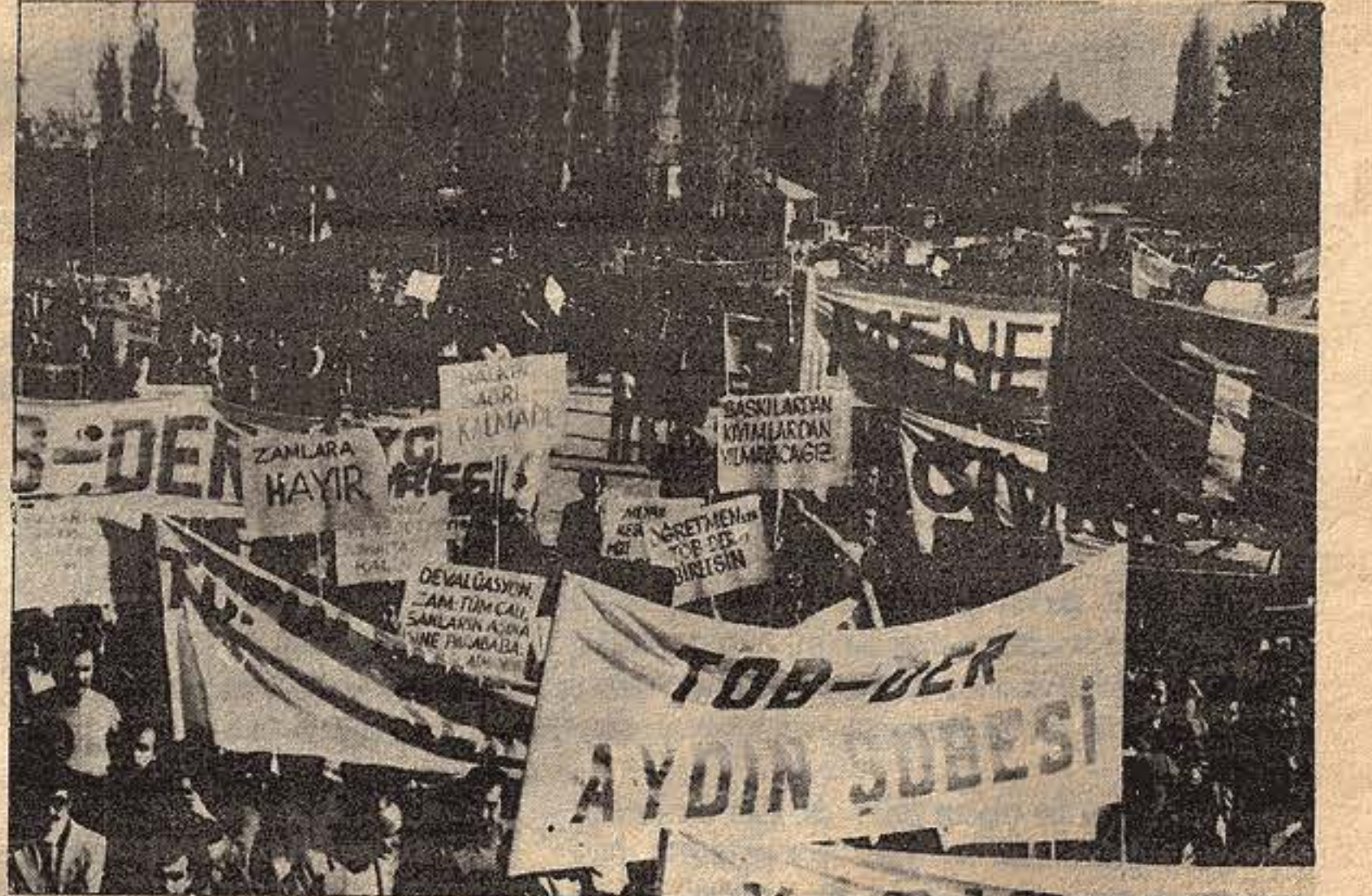
Kiteler Denizli'de hayat pahalılığını, taban fiyatlarını ve faşist baskıları protesto ettiler...