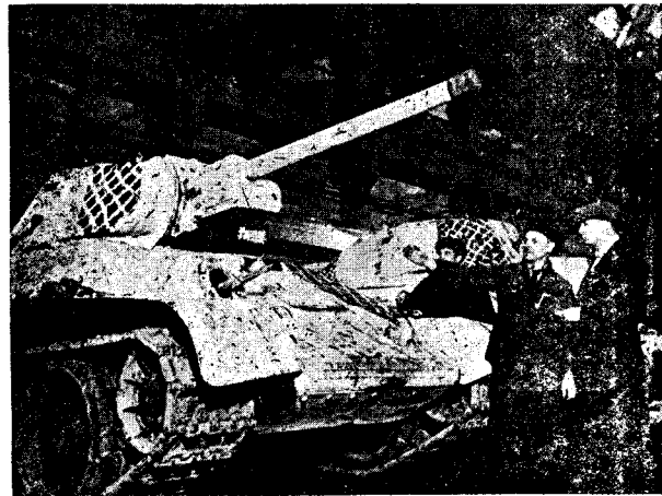
Karxaneyên rûsî her meh bi hezaran tang çêdikir. Ev tanên ke nemaze ji bona çêrên zivistanê gelek bikêrhatî ne.