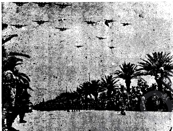
Top û balafir, tang û qumbereavêj, eskerên Hevalbenda tekîlî vê şahînetê bûne.