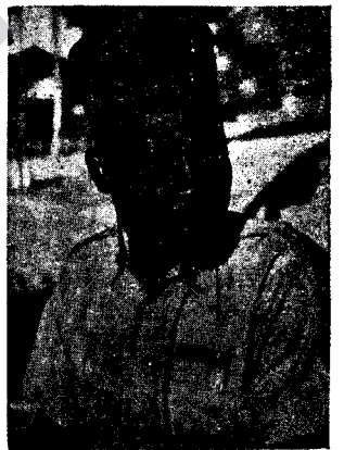
Reşîk şerevaniyine bi zirav û eskerine sernerm in.