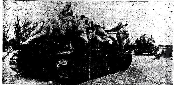
TANGEKE SOVYETÎ A MEZIN. DINYA ZIVISTAN E, Eskerên rûsî kurkine spî li xwe kirine, wilo çavê dijînin zu bizû li wan na keve.