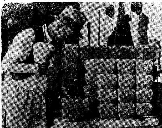
KEVIRTIRAŞEKE HÊJA, MAMOTEYERÎ XWEDÎ SEBÎR Û ZÊREK

Rêçezanî ji bona gehîştina xorta awayekî heja û dibîstaneke qîmetdar e.