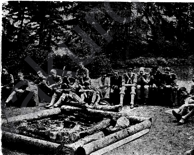
RÊÇEZANÊN BRITANÎ DI NAV DAR Û DARISTANAN DE

Îşê her mîletî ê mezintir gîhaştina xorta ye. Xortê hevî, qiwet, pêşî û cavdaniya mîletî ne. Xelkê ewripayê, û xelkên mîletên dinyayê ên çav-vekirî heke hewce bû, xwarîna xwe kêmanî dikin û zaroyên xwe dişînin dibîstanan. Roja ko kurda ji bi tevayî, bi veyê qeydê emel kirin, mîletê me dê bibe mîletekî xurt û candar.