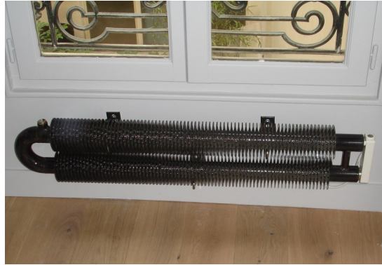
2SE électrique version K48-98-10